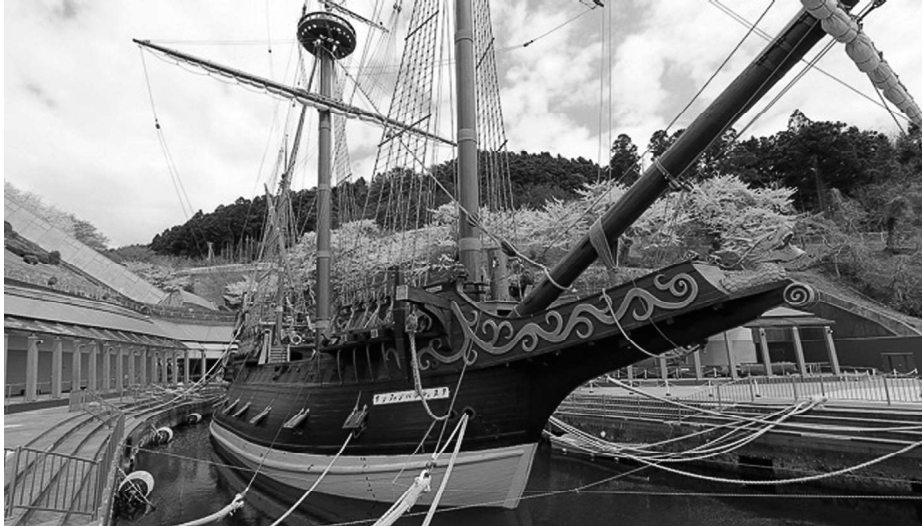
Reproducción del galeón San Juan Bautista .

mayo de 1617 arribaba el galeón por segunda vez a Acapulco, donde esperaban el diplomático japonés y el franciscano Sotelo con el gesto amargo de la derrota en sus rostros. Sabemos que el año siguiente la nave fue vendida definitivamente a los españoles de Filipinas, que mantuvo su nombre y que sirvió para defender aquellas posesiones españolas de los holandeses, quienes buscaban ocupar el puesto en Extremo Oriente que hasta entonces habían ostentaban los ibéricos. Hasekura regresó en 1620 a un Japón distinto que se preparaba para un largo periodo de aislamiento. La nación que con tanto empeño había tallado un galeón para llevar a sus diplomáticos a miles de millas de distancia se replegaba sobre sí misma y cerraba todos sus puertos a los extranjeros, salvo el de Dejima. La historia del San Juan Bautista se perdía definitivamente, lo mismo que la salud de Hasekura, que en 1622 fallecía, quien sabe si con la pena en sus adentros por no haber logrado lo que su señor le había pedido hacía algo más de un lustro y que pudo haber obrado un marco mejor para las relaciones entre ambos países.