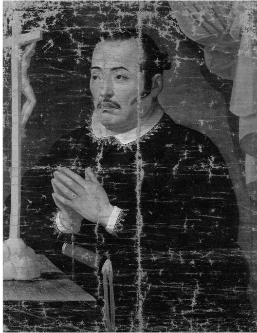
El samurái Hasekura Tsunenaga, cabeza de la embajada a Europa, orando ante un crucifijo.

ella se quería ahondar en el camino del comercio y de las relaciones náuticas, pero, como sabemos, no fructificó. En Japón se vivía una etapa de franca persecución contra los cristianos (ya fuesen de origen europeo o bautizados luego en el país asiático), contra los que se promulgaron varios edictos. Por su parte, los españoles consideraron que la legación nipona era de «perfil bajo», de la que poco provecho se podría obtener, al encabezarla el representante de un señor feudal y no un miembro mismo de la nobleza japonesa, un príncipe o el propio señor de la región. Muchos anhelos, en definitiva, que no se cumplieron, pero que hicieron posible una bella historia marinera que aún se recuerda, tanto en tierras niponas como en españolas: la luenga travesía del San Juan Bautista .