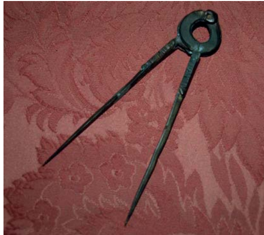
Compás del San Jerónimo . Museo Naval de Ferrol.

Indicar además que desde el mismo momento del naufragio se intentó recuperar de los pecios todo lo que se pudo, obviamente. De hecho, en 1597 la desafortunada formación de Martín de Padilla estaba lista para marchar sobre Inglaterra, lo que indica que se pudo rescatar buena parte de lo perdido. Y ya hemos visto cómo a veces los lugareños, o empresas de salvamento, extraían materiales de los naufragios. No se trataba, ni mucho menos, de yacimientos intactos.