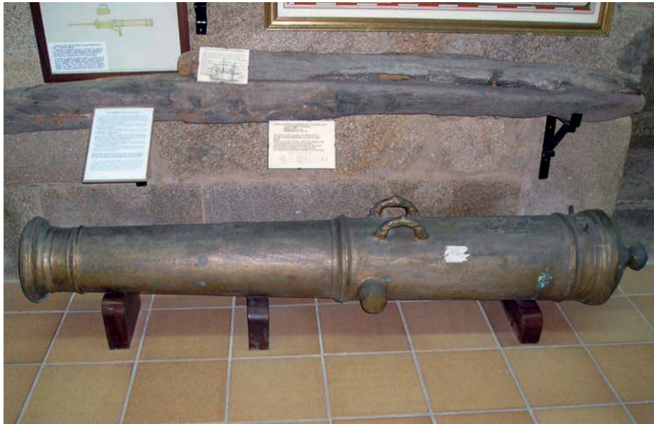
Cañón de bronce y restos de madera procedentes del pecio. Museo Naval de Ferrol.