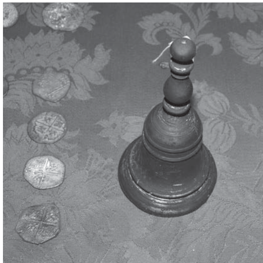
Campanilla y monedas del galeón. Museo Naval de Ferrol.

1596, los ingleses deciden volver a atacar. Esta vez son unas 150 naves con 14.000 hombres y se dirigen contra Cádiz. La vergonzosa actitud de las principales autoridades gaditanas, más preocupadas de su huida que de su honra, propició que la ciudad cayera con muy poco esfuerzo. Durante 15 días, Cádiz fue tomada, saqueada e incendiada. La Flota de Indias, que estaba allí lista para zarpar, fue incendiada para evitar su captura.