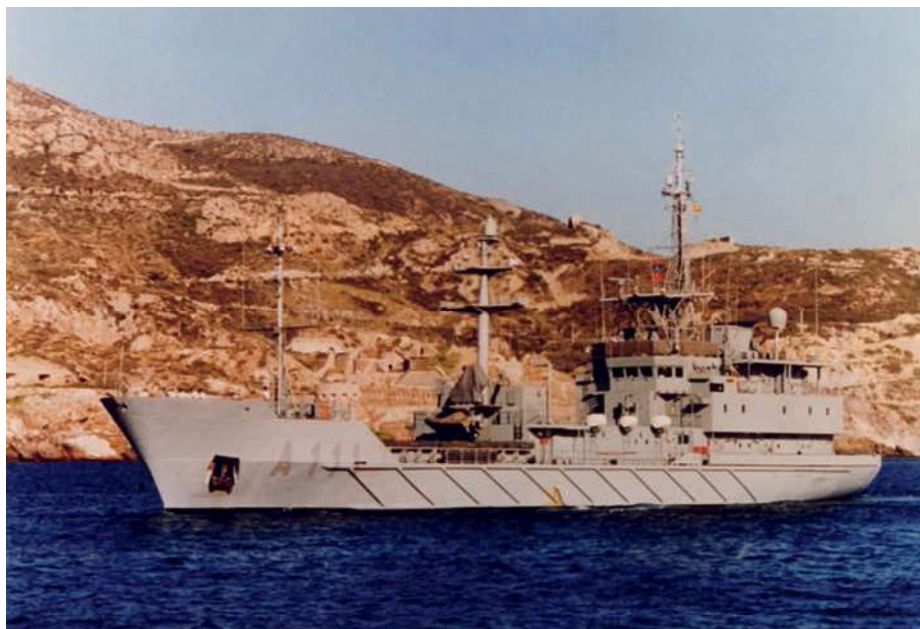
Alerta (A-111).

Estos comienzos estuvieron acompañados de un desarrollo I + D en las empresas tecnológicas nacionales y un avance importante de la EW y la SIGINT en la Armada, con la creación de la Sección de EW en el Estado Mayor de la Armada (EMA), el desarrollo de doctrina nacional por la Junta de EW, los primeros desarrollos de SIGINT con Órdenes de Batalla Electrónicos y Bases de Datos de Emisores por la Sección de Inteligencia del EMA, y la potenciación en la formación del personal de la Armada en todos los niveles en EW con la creación del Centro de Instrucción de Guerra Electrónica (CIGE) dentro del desaparecido Centro de Instrucción y Adiestramiento de la Flota (CIAF), posteriormente en el Centro de Programas Tácticos y Centro de Instrucción y Adiestramiento de la Flota (CPT-CIA) y hoy el Centro de Instrucción de la Flota (CIA), potenciando además la EW en la especialidad de Electrónica para oficiales, suboficiales y marinería.