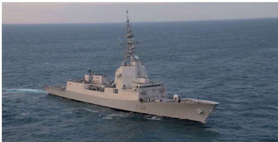
Fragata Blas de Lezo (F-103). (Foto: Armada española).

puedan crear conciencia, pero en el sentido de la «erótica» del espionaje, no en el de la Defensa y Seguridad.