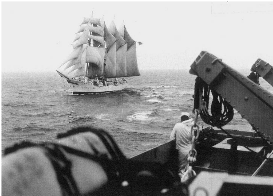
Fotografía del Juan Sebastián de Elcano tomada desde el USS Pocono.

nuestro atraque, maniobra general, arriado y carga de todo el aparejo y saludo al cañón. Fue suficiente para que nuestro Elcano se convirtiese en el destacado y preferido entre los 113 buques participantes de las 17 naciones invitadas (2). Reconozcamos su singularidad.