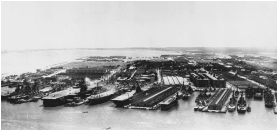
El Elcano a proa del mayor portaviones, a la izquierda.

Cada barco invitado contaba con su correspondiente buque anfitrión; así, a nuestro Elcano se le asignó uno auxiliar de la Aviación Naval, pintado también de blanco, mientras que al portaviones HMS Ark Royal , que estaba a