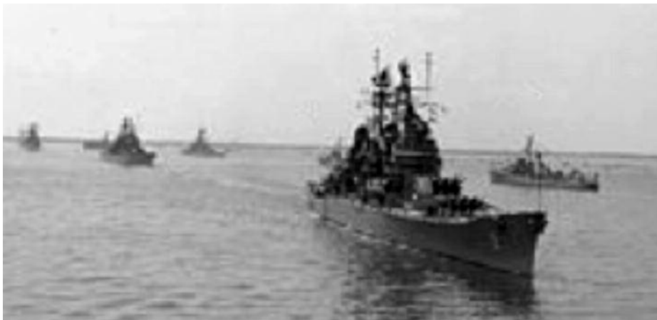
USS Canberra (CAG-2).

La Revista Naval tuvo lugar el 12 de junio. Desde el día anterior los buques participantes se encontraban fondeados en dos largas líneas orientadas al Este de una longitud próxima a las quince millas y separadas una milla.