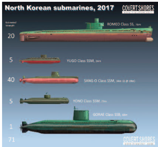
Submarinos norcoreanos en 2017. (Fuente: SUTTON, H. I)..

Tanto los oceánicos como los costeros son de diseño soviético y algunos proceden de unidades vendidas por Rusia a China; los más modernos son de manufactura norcoreana, pero copia de un diseño soviético o yugoslavo.