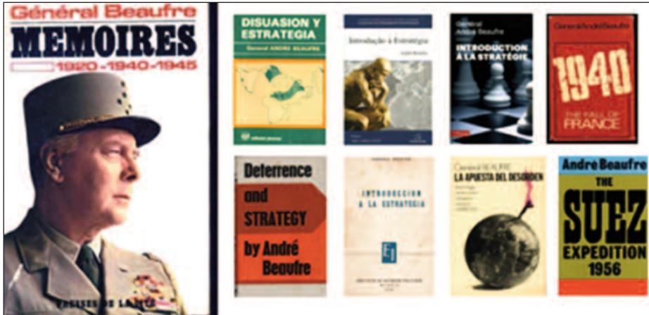
El general André Beaufre, gran estratega de la disuasión nuclear. (Foto del autor).

o Suez 1956 y su visión desde las altas esferas de un país como Francia, que luchó por tener esta capacidad, nos permite ponerlo como ejemplo.