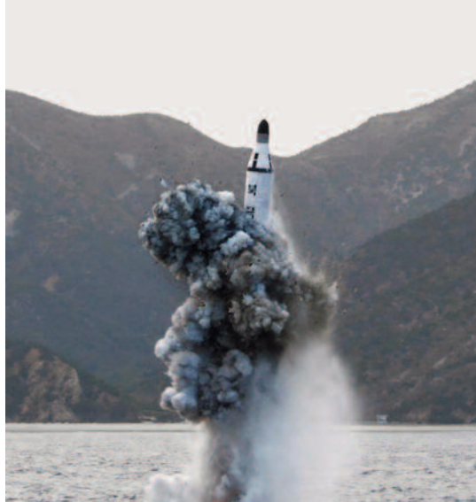
Imagen del lanzamiento del KN-11.

Esta plataforma se utilizó por primera vez el 23 de enero de 2015 y después el 22 de abril, consiguiendo el 8 de mayo el primer lanzamiento con éxito desde un submarino. El 28 de noviembre, en un nuevo intento, resulta dañado el submarino; poco después se vuelve a repetir con éxito el