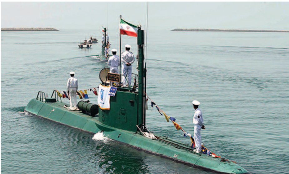
Submarino iraní clase Ghadir .

La última novedad que tuvimos sobre los submarinos norcoreanos fue la pérdida de uno de ellos, no sabemos de qué clase, en marzo de 2016 (18). Este es el problema, que nos encontramos a veces con las noticias de Corea del Norte, que muchas son secretas y otras meras filtraciones interesadas de otras naciones.