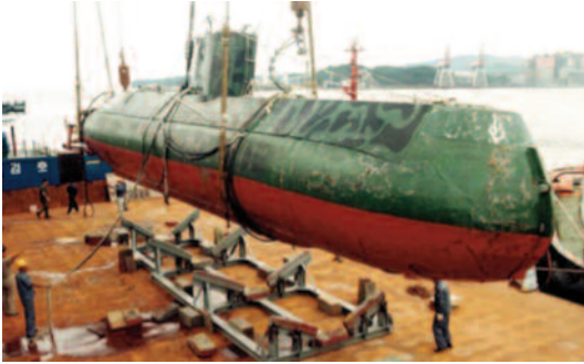
Submarino clase Yugo rescatado por Corea del Sur.

Los Yono nos pueden parecer pequeños —solo cuentan con dos tubos lanzatorpedos—, pero son de gran utilidad en aguas poco profundas como las del mar Amarillo o el golfo Pérsico; prueba de ello es el interés del régimen de Irán por copiar este modelo de minisubmarino en su clase Ghadir , que tantos quebraderos de cabeza causa a nuestros aliados en el Golfo.