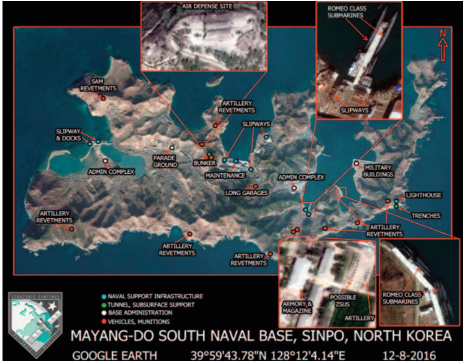
Base Naval de Sinpo, Corea del Norte.

nos clasifica los submarinos de mayor a menor operatividad y peligrosidad; indicando, los que se cree están fuera de servicio.