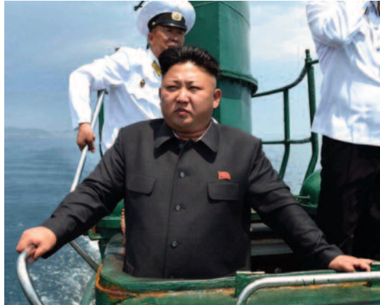
El líder norcoreano a bordo de un submarino clase Romeo . (Fuente: KCNA).

Podemos pensar que esto no nos afecta, que un submarino convencional norcoreano, por muy balístico que sea, es imposible que llegue a España; pero claro, si tenemos en cuenta los vínculos del régimen norcoreano con otros países, esa idea empieza a intranquilizarnos. En este artículo vamos a analizar la situación actual del programa del submarino balístico norcoreano y las posibilidades de convertirse en una futura amenaza.