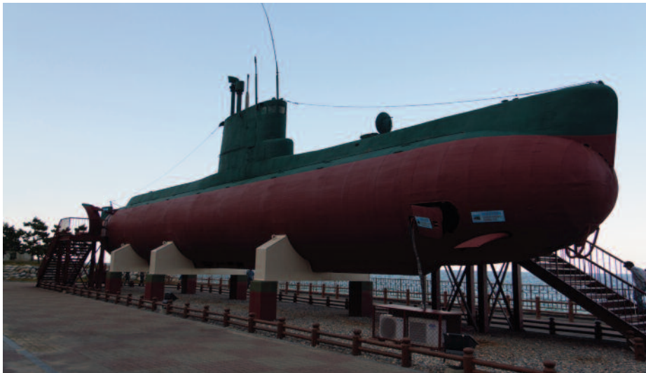
Submarino clase Sang-O capturado en Gangneung (13).

norteamericanos (14). La dificultad a la que se enfrenta el régimen norcoreano con el fuerte embargo que soporta obliga a pensar que estos proyectos de enorme dificultad quedarán solo en fase conceptual o embrionaria.