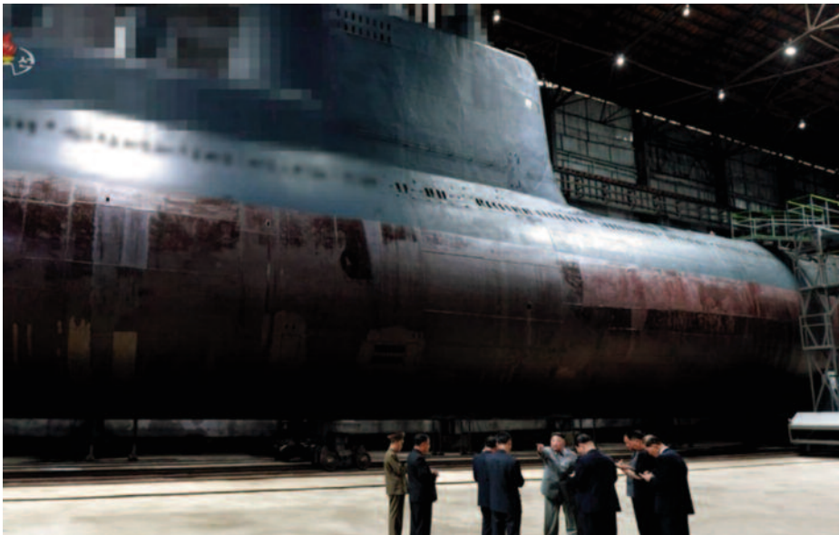
Imagen de un submarino clase Romeo modificado en julio de 2019.

Corea del Norte muestra también interés en la propulsión nuclear, noticia que no compartimos, pero que ha visto la luz en diferentes medios japoneses y