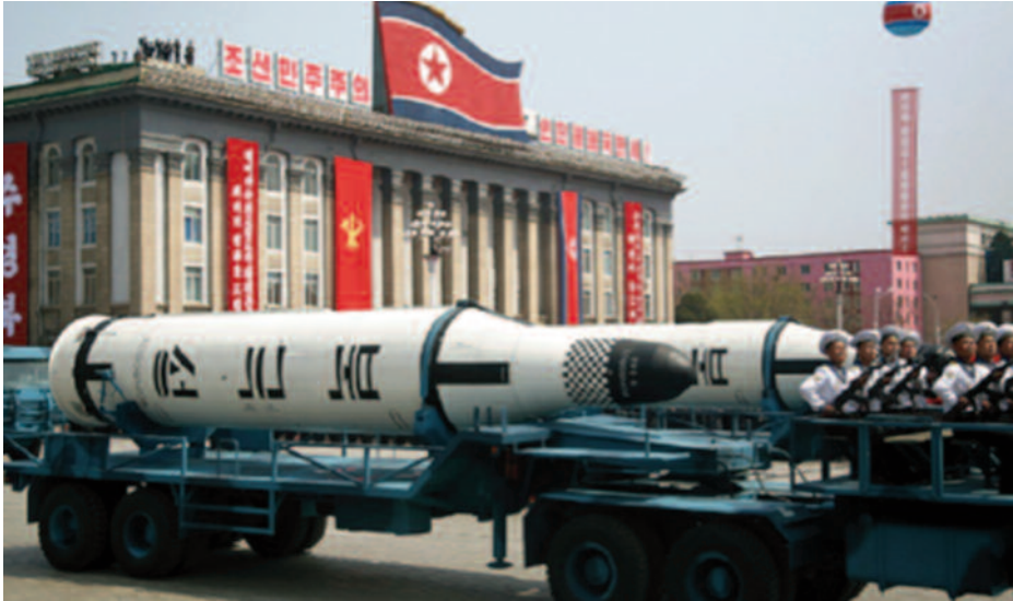
Misil SBLM NK-11, mismo modelo que el lanzado desde un submarino.