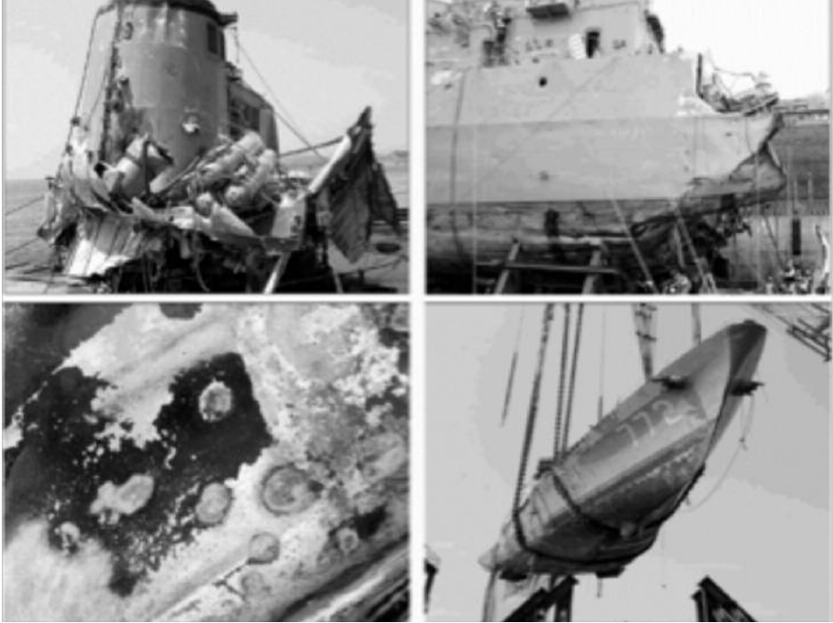
Reflotamiento de la Cheonan . (Fuente: Republic of Korea Navy).

Además de esta acción, que podemos considerar muy grave, los minisubmarinos norcoreanos han actuado en diferentes episodios contra sus vecinos del sur. Recordemos que Corea del Norte cuenta con más de setenta y cinco submarinos, doce de ellos minisubmarinos de la clase Yono , el mismo tipo que probablemente hundió la Cheonan .