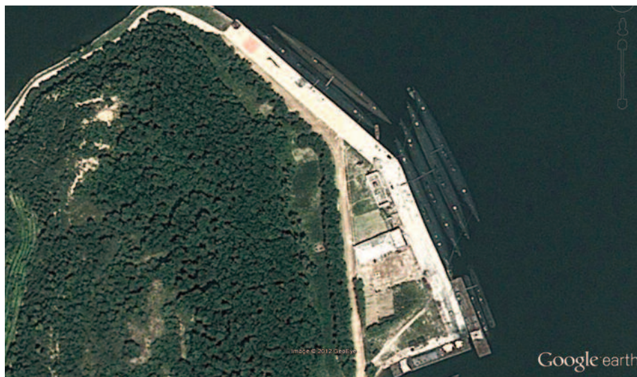
Imagen donde se observa submarinos del tamaño de los Romeo y otros Sang-O .

En resumen, el pilar de la Fuerza Submarina norcoreana, la clase Romeo , se está quedando obsoleta y está siendo sustituida por la clase Sang-O , submarinos costeros de tamaño pequeño, con un desplazamiento de 325 toneladas y cuatro tubos lanzatorpedos de 533 mm, que también pueden usarse para lanzar minas, pudiendo transportar hasta 16. Existe una versión modificada, sin armamento, diseñada para el transporte de equipos de operaciones especiales, y otra más larga, la clase Sang-O-II , de la que se sabe poco y que fue descubierta gracias a una imagen satélite en 2011 (19).