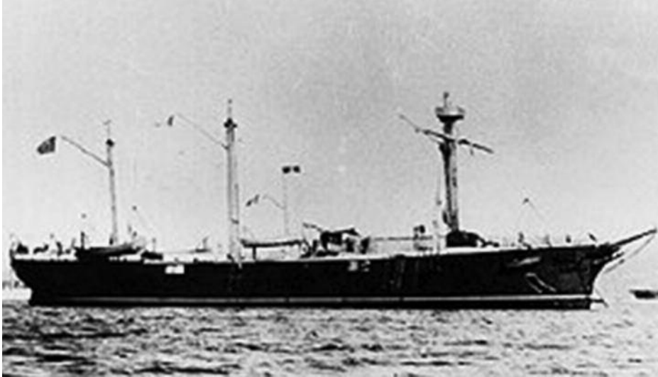
Cañonero Magallanes . (Foto: www.wikipedia.org ).

Previamente, por Real Orden de 12 de julio de 1897 (27), se aprobaban los reglamentos de dotación tanto de su viaje de ida a Fernando Poo como de pontón en la rada de Santa Isabel. En este último caso la dotación estaba formada por un teniente de navío, un alférez de navío, un contador de navío, un primer médico, un tercer contra maestre, un tercer condestable, un aprendiz de maquinista, un escribiente, un practicante de segunda, dos cabos de mar de primera clase y dos de segunda, un artillero de mar, un armero, un mozo de despensa, un cocinero de equipaje, un marinero panadero, cuatro marineros de primera clase, veinte de segunda clase y cuarenta krumanes. Por una Real Orden de 20 de agosto de 1897 se le cambia el nombre por Fernando Poo y por otra de 27 del mismo mes se le asigna el numeral 70 y la señal distintiva G. R. F. Q. (28). En Cartagena se le sometió a pequeñas reformas para poder ser utilizado como enfermería flotante y, tras arribar a Cádiz en octubre de 1897, partió en noviembre a la colonia, llegando a Santa Isabel en enero de 1898 al mando del teniente de navío Agustín Pintado y Llorca. Pocos años fue utilizado como pontón, ya que por el mal estado de sus fondos fue varado en la playa, y en diciembre de 1903 (29) se ordenó su baja en la lista