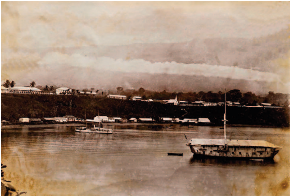
Pontón Ferrolana .

En 1862 se presentó la primera de las tres grandes epidemias que afectaron Fernando Poo en este período. Se trataba de fiebre amarilla, importada de la costa africana por un pontón inglés que recaló en Santa Isabel, y que causó