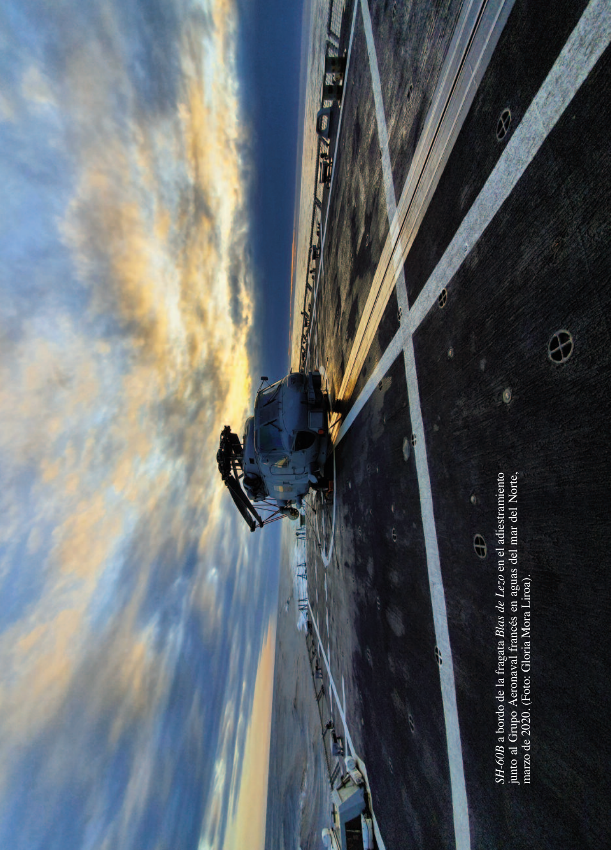
SH-60B a bordo de la fragata Blas de Lezo en el adiestramiento junto al Grupo Aeronaval francés en aguas del mar del Norte, marzo de 2020.