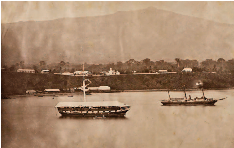
Pontón Ferrolana y goleta Ligera . (Fuente: shelly.es ).

ción Naval y capitán del puerto de Santa Isabel; dos oficiales subalternos del Cuerpo General de la Armada, los cuales podrían ser sustituidos, total o parcialmente, por pilotos mercantes; dos oficiales del Cuerpo Administrativo, un profesor de Sanidad, un capellán, primer y segundo contra maestre, un maestre de víveres, un despensero, un practicante de cirugía, primer y segundo carpintero, un armero, un buzo, un escribiente, un condestable, cuatro soldados de Infantería de Marina, un cocinero, cuatro cabos de mar, seis marineros preferentes, diez marineros ordinarios y treinta negros krumanes (13). Estos eran contratados para realizar aquellos trabajos que no podía desempeñar la marinería europea sin detrimento de su salud, fundamentalmente en labores al sol y a la intemperie. En abril de 1861 se determinó que era preferible contratar negros españoles, tomando krumanes solo en el caso de no encontrarse de los primeros.