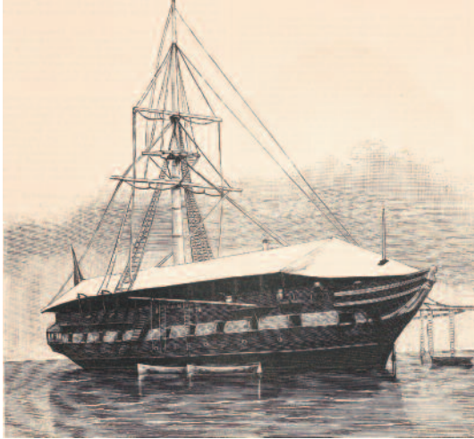
Pontón Ferrolana .

Estatuto orgánico de la colonia. El ahorro se hizo patente, entre otras medidas, con la unificación del cargo de gobernador y de jefe de la Estación Naval en una misma persona, con graduación por lo menos de capitán de fragata, y en la supresión de las unidades del Ejército, quedando para defender nuestra soberanía en la zona solo la Armada.