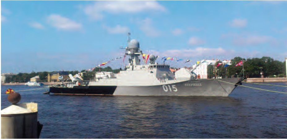
La corbeta Machkala , clase Buyan .

2 x 30 mm CIWS; SSM Kalibr y SAM Komar, de muy corto alcance); tres corbetas Buyan (62 metros; 650 Tpc; 1 x 100 mm; 2 x 30 mm CIWS y SAM Gibka de muy corto alcance), así como dos corbetas Tarantul (56 metros; 600 Tpc; 1 x 76 mm; 2 x 30 mm CIWS; SSM SS-N-22 y SAM SA-N-5 de muy corto alcance (9).