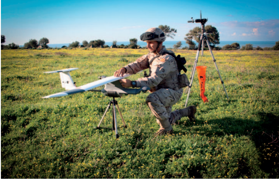
Operador de sistema no tripulado preparando un Alcotán .

La utilización de UAV, además de su manejo y mantenimiento, implica poner a disposición de las unidades una mayor cantidad de información de inteligencia que hay que analizar e incluir en el planeamiento de las operaciones, para lo cual se debe contar con personal con la formación adecuada.