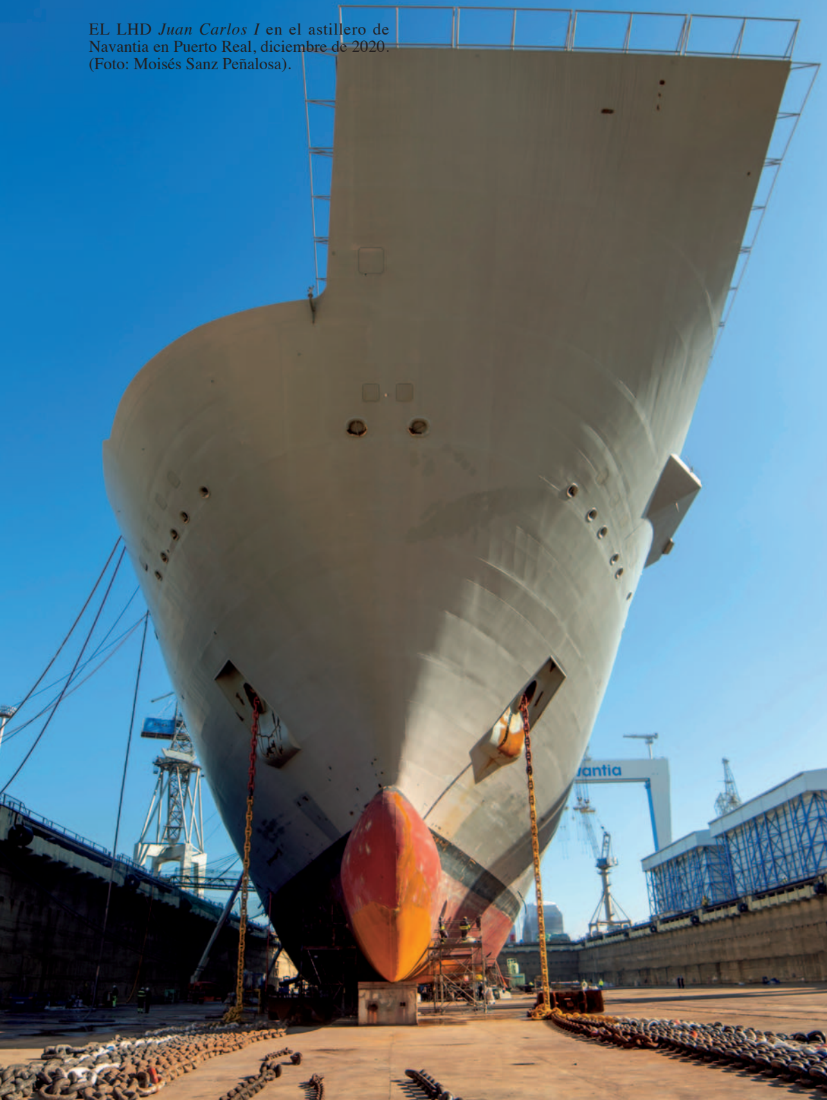
EL LHD Juan Carlos I en el astillero de Navantía en Puerto Real, diciembre de 2020. (Foto: Moisés Sanz Peñalosa).