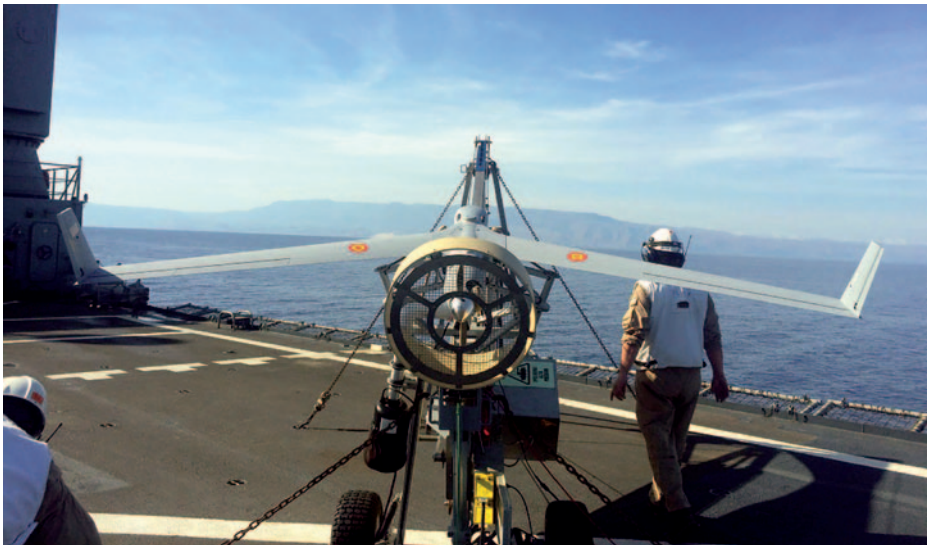
Scan Eagle sobre la cubierta del buque Galicia . (Foto: www.flickr.com/photos/armadamde ).

El hecho de que su piloto no esté a bordo del aparato tiene ventajas e inconvenientes. Entre las primeras, destacar que pueden llevar a cabo misiones de reconocimiento de zona en ambiente NBQ, que son más complicadas para una aeronave convencional. Sin embargo, tienen varias desventajas. En