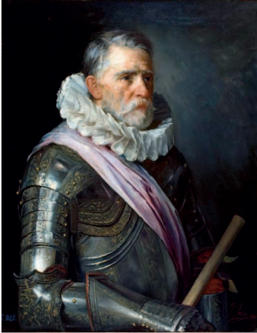
Francisco Jover y Casanova. Retrato de Luis de Requesens y Zúñiga. (Museo Nacional del Prado)

Como vemos, Felipe II quería que Requesens no fuera solo el segundo de su hermano para suplirle en su ausencia o enfermedad, que eran las atribuciones propias del cargo, sino que le otorgaba facultades de consejero y tutor. Pero llegados a este punto, el lector neófito se preguntará quién era Requesens y cómo era posible que Felipe II confiara tanto en él.