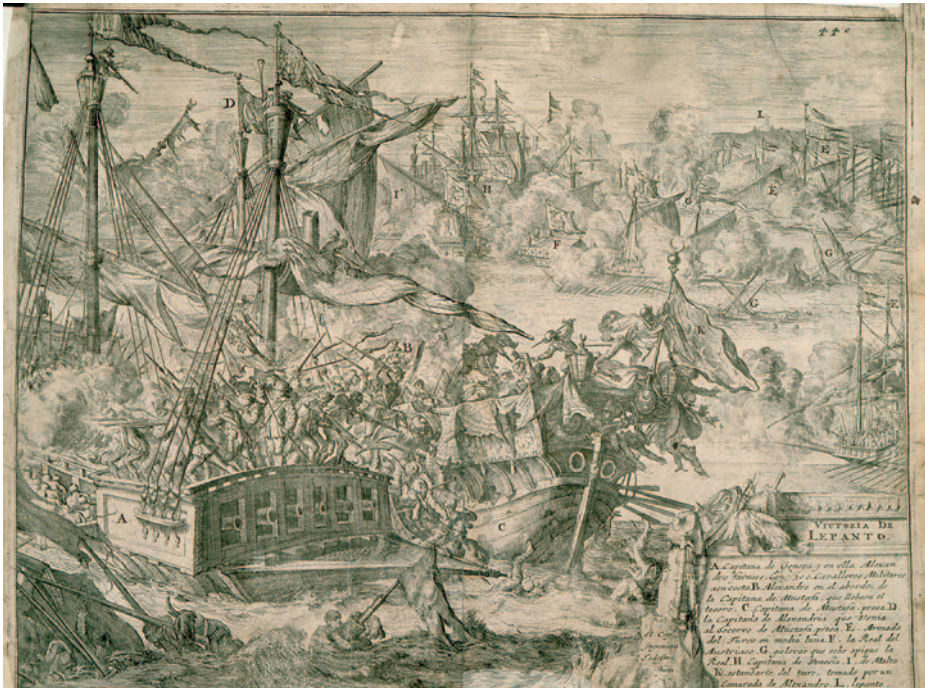
La capitana de Génova en la batalla de Lepanto. Grabado del capitán ingeniero Juan de Ledesma incluido en la obra Primera Década de las Guerras de Flandes... Colonia 1681. (Biblioteca Nacional)

«El Rey--D. Luis de Requesens, Comendador mayor de Castilla, del nuestro Consejo de Estado y Lugarteniente general de la mar. Vuestra carta de 1.º de agosto sobre lo que habíais pasado con mi hermano a la partida de Génova, recibí a 10 del mismo, y me ha pesado mucho que se haya atravesado cosa de disgusto entre mi hermano y vos, al cual yo escribo sobre esto y mando advertir de lo que conviene; y porque el Cardenal con quien yo he comunicado este negocio os escribirá lo que al el toca, sólo diré aquí que os agradezco mucho lo que en vuestra carta decís que procurareis que ninguna cosa baste a que se deje de anteponer a todo mi servicio, ni que a vos no asistáis a él con el mismo cuidado y amor que hasta aquí, de que yo tan satisfecho, cuanto me obliga la prueba de ello, y anqué por esto mismo entiendo que no es menester, todavía os encargo que procuréis por vuestra parte cuanto fuera posible la buena correspondencia en todos los negocios con mi hermano; que a él le encargo yo mucho lo mismo, como creo que lo hará , pues hay razón para ello, y se atraviesa también ser esta mi voluntad. En lo demás que toca a vuestra licencia, no hay que tratar ahora hasta que se acabe la jornada este verano,