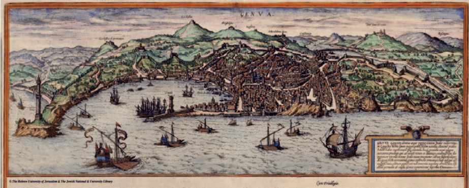
Génova en el siglo XVI. Universidad de Jerusalén

va adonde, tras una bonancible y plácida travesía, llegaron a primera hora de la mañana del 26 de julio. Recibido por el dux, por casi todos los príncipes de Italia y por Juan Andrea Doria —que se había adelantado días antes con su galera para asegurarle un buen recibimiento (13), ya que había recelos de que así fuera, pues hacía medio siglo que ningún marino genovés había mandado una escuadra española—, Juan de Austria se puso «en cuerpo y alma» a preparar con Requesens la expedición que debía enviar a Nápoles, pero enseguida se encontró con dificultades logísticas y crematísticas que aventuraban un retraso en su salida (14). Fue cinco días antes de su partida cuando se declararía el desagradable episodio que vamos a relatar.