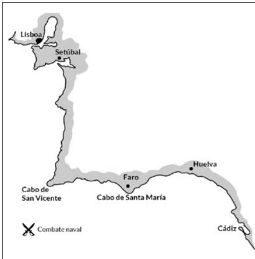
Combate naval y apresamiento del 9 de agosto de 1780

En relación con el combate, esto es lo que escribía un oficial inglés que iba a bordo del Hillsborough , un East-Indiaman , el 25 de agosto: