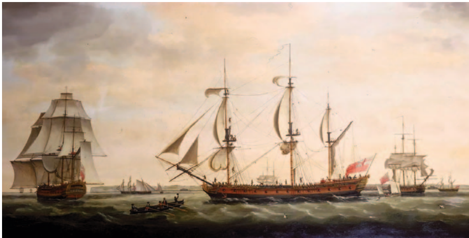
Indiaman Royal George en tres posiciones en los Downs.

El derrumbe de la Bolsa Real de Londres fue apoteósico, según expone el escritor y erudito británico Robert Graves en uno de sus libros basados en la autobiografía de Roger Lamb, un sargento del Ejército británico que luchó en la Revolución de las Trece Colonias: