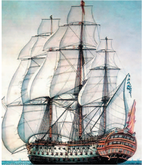
Navío Santísima Trinidad .

La noche del 8 al 9 de agosto, la escuadra combinada se hallaba en las proximidades del cabo de Santa María con rumbo hacia las Azores. Córdova había destacado varias fragatas en la dirección en que se esperaba avistar al convoy con instrucciones de informar mediante un código de cañonazos acordado previamente: «... y observando el general despues [sic] de la medianoche á [sic] barlovento una señal al cañon [sic], que por la distancia del sonido manifestaba hacerse á [sic] larga distancia, no quedó bien asegurado de su significacion [sic], por no haber podido contar los fognazos ó [sic] cañonazos, pero no dudando que la fragata de la escuadra de su mando que la hacia [sic]