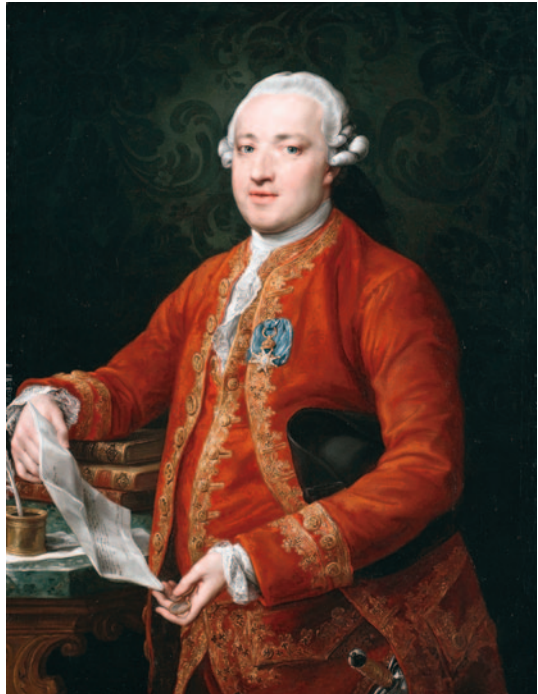
El conde de Floridablanca, por Pompeo Batoni, ca. 1776, Art Institute de Chicago.

El conde de Floridablanca lo indica también en sus memorias: