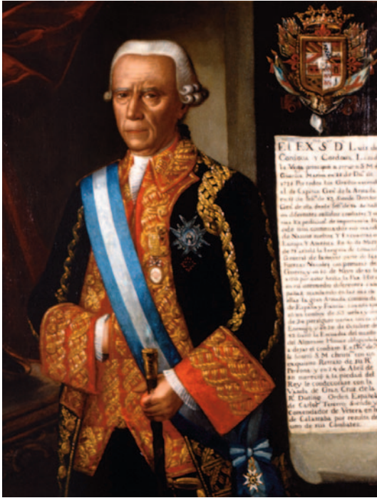
Luis de Córdova y Córdova. Museo Naval de Madrid.

no reconoció la independencia de las colonias americanas para evitar un posible «contagio» en la América hispana; por lo tanto, Estados Unidos y España se convertían en co-beligerantes contra Inglaterra, pero no en aliados.