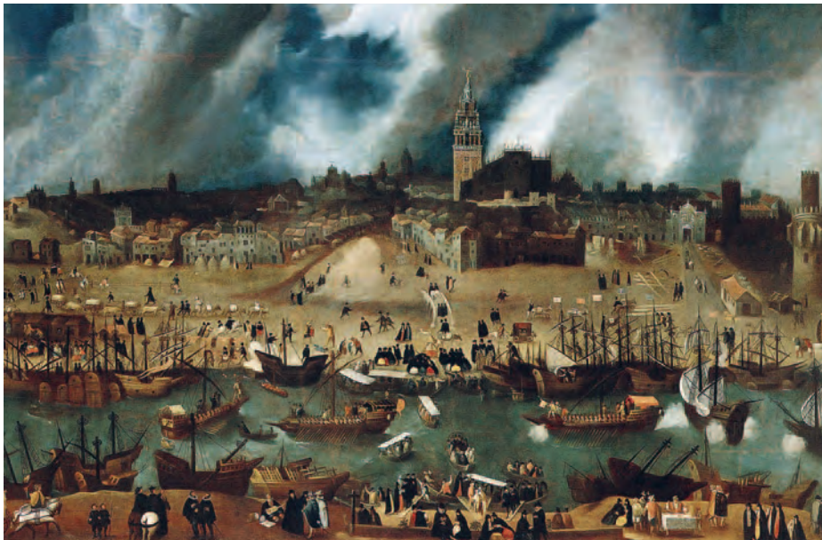
Vista de Sevilla desde Triana a finales del siglo XVI. Óleo atribuido a Alonso Sánchez Coello. (Museo de América)

España, quisieron poner en peligro aquel floreciente tráfico marítimo. Vano intento, pues la adopción de la navegación en convoy, junto con el advenimiento de los buques de escolta (o de guarda), consiguió neutralizar la amenaza, como así lo demuestra el hecho de las escasísimas flotas que se perdieron a manos de estos salteadores marítimos «de fortuna».