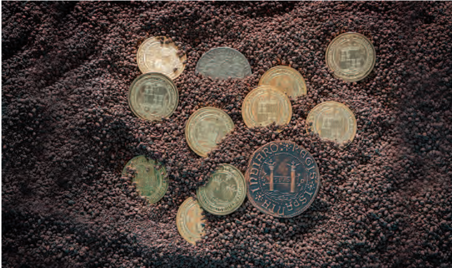
Monedas de la época.

tan apreciadas o más de lo que en la actualidad lo son el dólar o el euro, pues con ellas se podía comprar y vender en casi cualquier rincón del planeta.