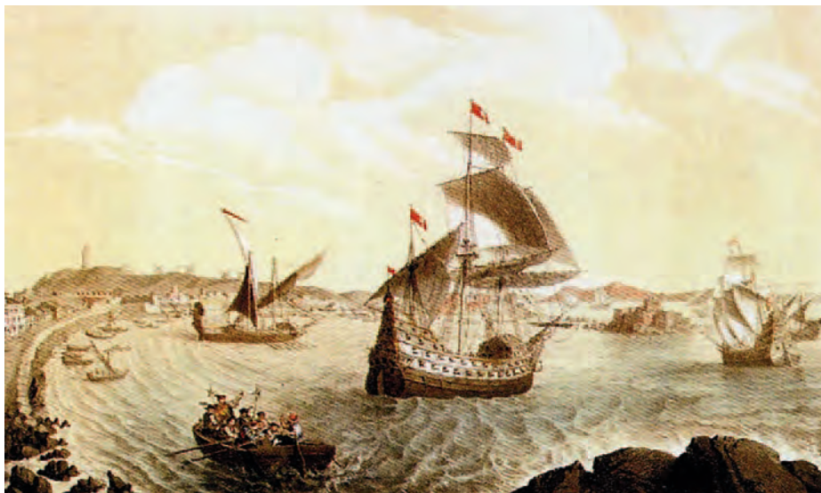
Partida desde La Coruña de la expedición de Loaysa. (Museo Naval de Madrid)

Aunque los buques supervivientes consiguieron llegar a las Molucas el 1 de enero de 1527, nunca regresaron a España al ser hostilizados por los portugueses (18).