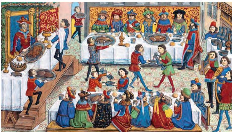
Escena de un banquete medieval. Reproducido del facsímil del códice La verdadera historia de Alejandro Magno (Bibliothèque Royale de Belgique).

Puede que el lector más neófito se pregunte la razón por la cual estos condimentos tenían tanta importancia en la época medieval, y quizás con un poco de imaginación pueda hacerse a la idea con el siguiente ejemplo: imaginemos la vida de un centroeuropeo un día cualquiera de invierno, en que la espesa niebla era sustituida con el pasar de las horas por un sempiterno cielo gris... Como es lógico, uno de los pocos alicientes que le proporcionaría la dura y monótona jornada sería deleitarse con una sabrosa comida. Pero no solo las especias servían para sazonar los alimentos, sino que algunas mejoraban su conservación y de ahí la importancia de disponer de ellas en suficiente cantidad y calidad. Por ello, pimienta, canela, clavo, nuez moscada, jengibre, vainilla y otras eran condimentos tan escasos como codiciados, ya que en una primera época llegaban a cuentagotas a Europa, principalmente a través de las repúblicas de Génova y Venecia, que tenían el monopolio de su distribución (7). No es extraño, pues, que se pagaran en oro y