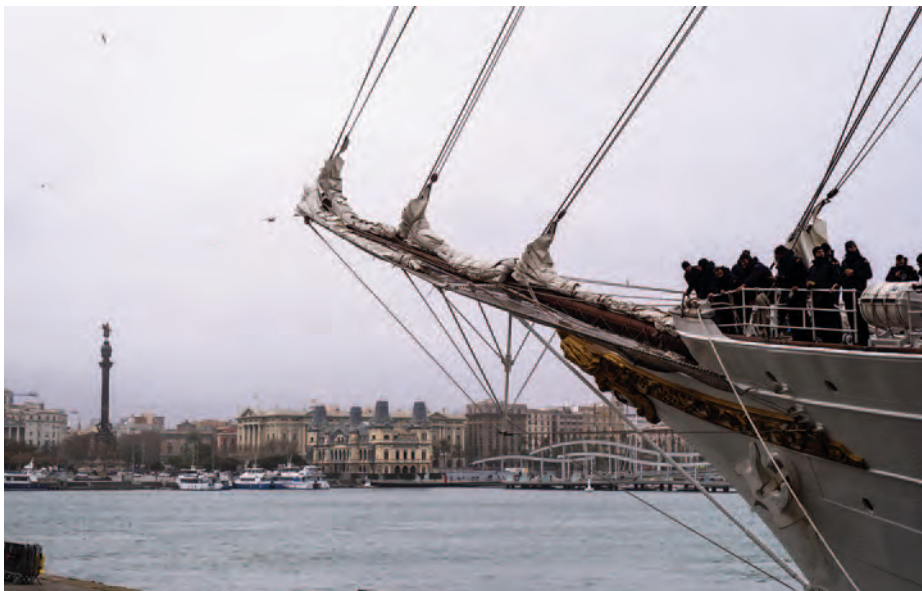
Escala en Barcelona del Juan Sebastián de Elcano, marzo de 2022.

Asimismo, y para que los jóvenes también hayan podido adquirir y apreciar un conocimiento básico de la gesta, se ha elaborado una publicación en formato cómic sobre la expedición y la vida de Elcano. Con un guion riguroso en lo histórico pero desenfadado en el lenguaje para hacerlo ameno y atractivo, la obra muestra los antecedentes del insigne marino de Guetaria antes de enrolarse en la expedición que preparaba Magallanes, las incidencias de la ruta que le llevaron a asumir el mando, la decisión de retornar a España continuando la navegación hacia el oeste y su muerte en el Pacífico a la cabeza de la segunda expedición que la Corona envió a las Molucas.