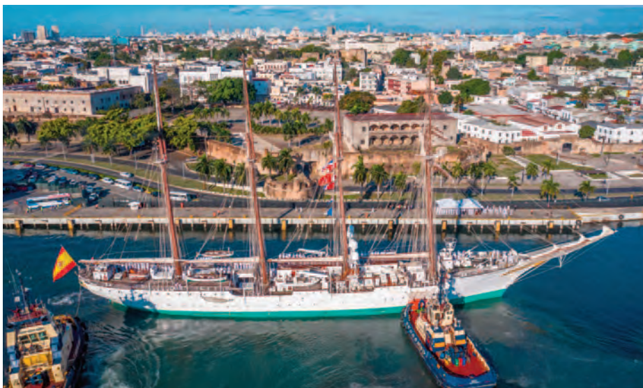
Escala del Juan Sebastián de Elcano en la República Dominicana, marzo de 2021.

Una de las características que ha distinguido la conmemoración del V Centenario es su enfoque exterior, sin el que hubiera perdido gran parte de su