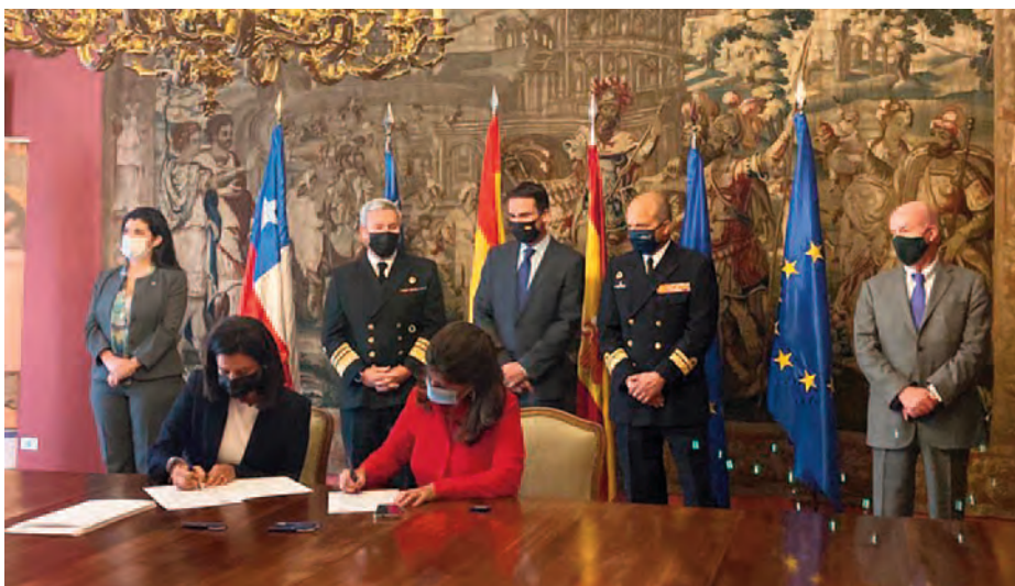
Firma de adhesión de la Universidad chilena a la «Cátedra Internacional CEU-Elcano. Primera vuelta al mundo».

Todo buen proyecto necesita un buen inicio, y en este aspecto la Armada, a través del Instituto de Historia y Cultura Naval, prestó decididamente su apoyo a la organización del Congreso Internacional de Historia de Valladolid, celebrado del 20 al 22 de marzo de 2018, que constituyó el evento académico más importante que jamás haya tenido la gesta de la primera vuelta al mundo.