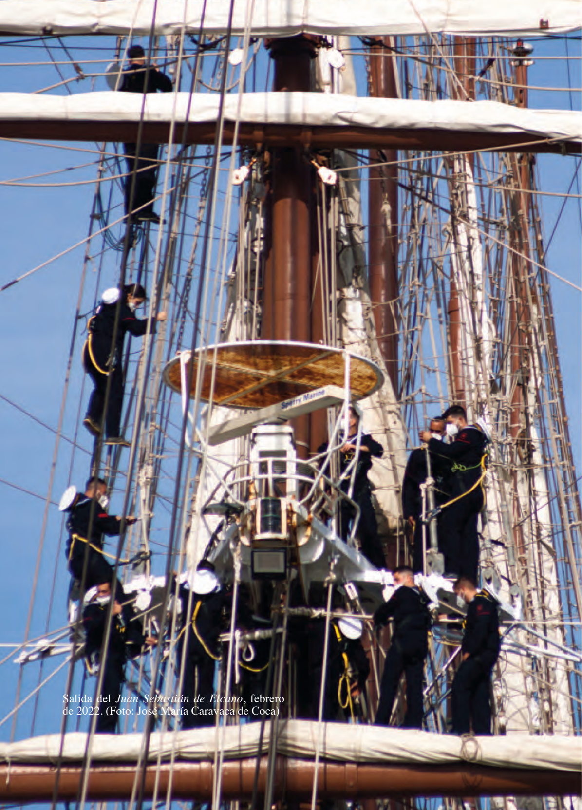
Salida del Juan Sebastián de Elcano, febrero de 2022.