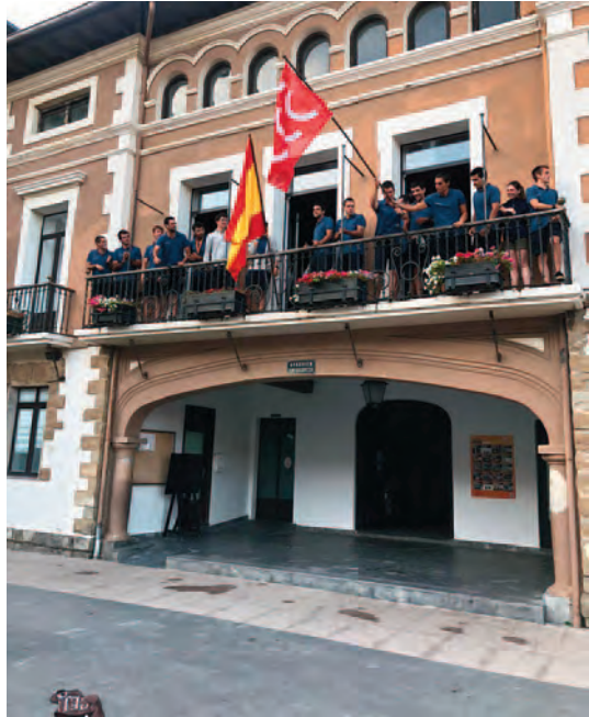
El equipo de traineras de Guetaria, campeones de 2021 en la fachada de su Ayuntamiento.

La Armada, para estimular la participación y la competitividad entre los participantes, ofreció a los ganadores de 3.º y 4.º de ESO tres plazas para embarcar en el Juan Sebastián de Elcano en la navegación de retorno a su base, de Marín a Cádiz, en el mes de julio, tras finalizar el XCIV Crucero de Instrucción. Y otras seis plazas a las otras tres categorías para realizar una visita la Base Naval de Rota y un bautismo de mar en el buque de acción marítima Audaz en coincidencia con la Revista Naval y la subida a Sevilla por el Guadalquivir realizadas por la Armada para conmemorar los 500 años de la llegada de la Victoria al mando de Elcano a Sanlúcar y Sevilla respectivamente.