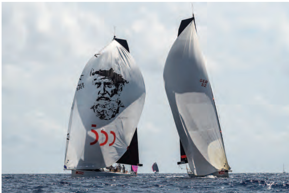
El Aifos en la Copa del Rey 2021.