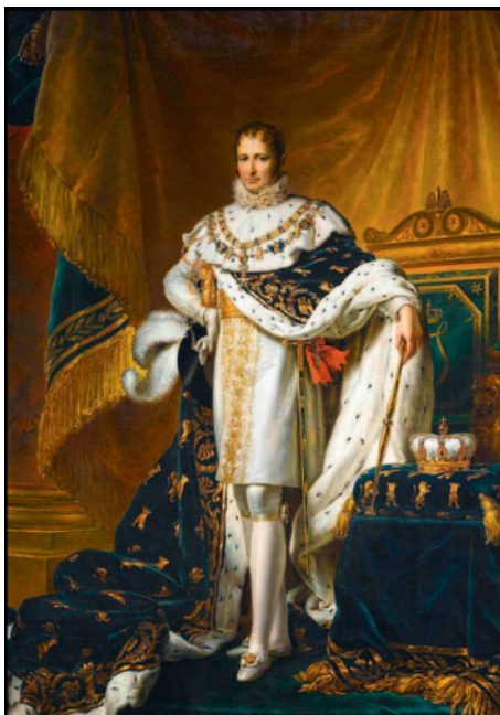
Rey José I.