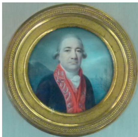
Retrato de Mazarredo.

Sobre Mazarredo me referiré a dos misiones diplomáticas que le encargó el gobierno español, una bien conocida, que fue la desempeñada en París como embajador plenipotenciario ante Napoleón, que coincidió con su mando de la escuadra secuestrada en Brest durante dos años y medio. La otra, menos conocida, la había desempeñado en Argel quince años antes. Ambas, desde el punto de vista diplomático, fracasaron, y por ello Mazarredo fue cesado en tales funciones. Evidentemente, el Bilbaíno, que siempre iba de frente y sin dobleces, no estaba dotado para la diplomacia.