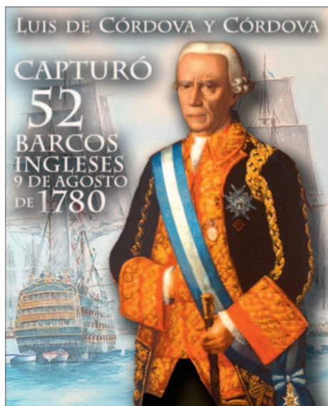
Captura de un gran convoy inglés por Cordova.

Mazarredo tuvo el acierto de saber escoger sus colaboradores, elección que siempre es incierta y de trascendencia indudable para el que manda. Entre los elegidos, pronto se destacó un teniente de navío de excepcionales cualidades, que estaba destinado por sus méritos a brillar ostensiblemente en la Armada y en la vida política del país: se llamaba don Antonio de Escaño.