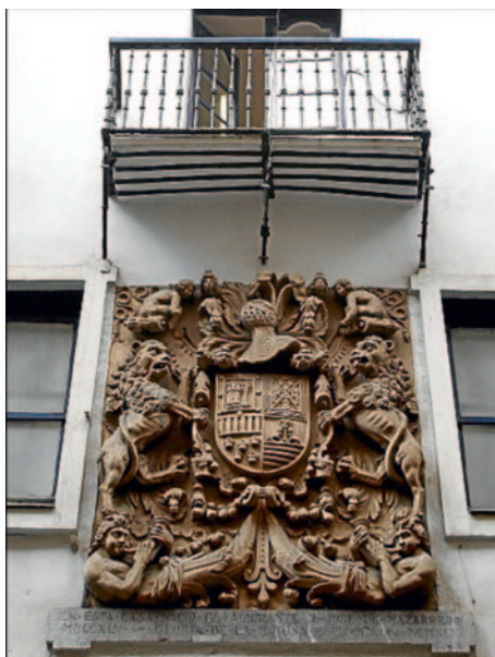
Casa natal Mazarredo.

Pero este plan fracasó debido al alejamiento de Mazarredo de las instrucciones que había recibido y a las intrigas y conspiraciones del francés. Maza-