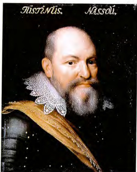
Justinus van Nassau (1559-1631), por Jan Anthoniszoon van Ravesteyn. Rijksmuseum, Amsterdam.

saliendo del Canal. Destacó a Drake hacia las proximidades de la isla d'Ouessant; allí encontró una embarcación inglesa enviada en descubierta hacía varios días, la cual le informó de haber hablado con la dotación de un navío irlandés abordado y tomado a remolque el 2 de julio por la urca española Paloma Blanca perteneciente a la armada; sus tripulantes confirmaron la dispersión de las fuerzas españolas y la reunión posterior en La Coruña. A la vista de esta situación, Howard decidió mantenerse en el Canal y adoptar un despliegue de la flota en tres divisiones a la vista una de otra, de modo que si alguna descubriese la armada española podría dar aviso inmediato a las otras agrupaciones para atacar al enemigo una vez reunidas. El almirante permanecería en la zona central del Canal con la fuerza principal; Hawkins se sustituiría hacia la parte de las Scilly