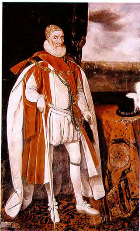
Charles Howard, lord Effingham y conde de Nottingham (1536-1624), c. 1620, por Daniel Mytens. National Maritime Museum.