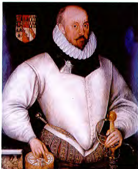
Lord Henry Seymour. Por Jan Anthoniuszoon van Ravesteyn. Rijksmuseum, Amsterdam.

Cuando era inminente la aproximación de la armada, las fuerzas de tierra inglesas apostadas en su mayor parte en el condado de Kent y Londres, estaban al mando supremo de Robert Dudley, conde de Leicester, teniendo como lugarteniente a lord Grey, mientras la caballería permanecía a cargo de Henry Radcliffe, conde de Sussex, y la infantería a las órdenes de sir John Norris (87). La movilización de estas fuerzas fue precipitada y, sus efectivos escasamente armados, de tal forma que las autoridades inglesas antes de la llegada de Medina Sidonia, no habían logrado crear un sistema defensivo eficaz en las costas