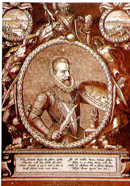
Alejandro Farnesio, duque de Parma (1545-1592). Grabado por Gisbert van Veen, s. XVII. Biblioteca Nacional, Madrid.

Durante la estancia en puerto, Howard fue visitado por personalidades de Zelanda que le ofrecieron «los servicios de todas las islas y ciudades» de su país a la reina de Inglaterra, especialmente de Middelburg (Walcheren, Zelanda). Allí recibió la noticia del fallecimiento del marqués de Santa Cruz por conducto de un danés que venía de Lisboa, quien asimismo le informó de que los preparati-