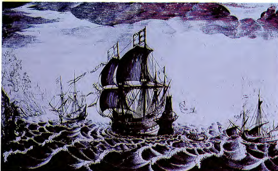
Galeón inglés visto por su aleta de estribor. Grabado de un original de Pieter Brueghel, s. xvi. Patrimonio Nacional, Biblioteca del Palacio Real, Madrid.

agentes ingleses fue Nicholas Oseley, comerciante establecido en España, cuya labor de espionaje sería destacada por el propio Howard (108). Otro era Edward Burnham, agente de Walsingham que actuaba en los Países Bajos, tanto en los españoles como en los rebeldes (109). Era conocida la labor de información realizada por los corsarios ingleses y franceses, capturados en su mayoría por la escuadra del conde de Santa Gadea; de ahí la necesidad de desembarcarlos «por muchos inconvenientes de consideración», entre ellos el espionaje. Por lo tanto, el Rey ordenó ingenuamente al conde que se repartiesen los prisioneros entre monasterios y personas religiosas, «para que los doctrinen y tengan en su servicio», en lugares apartados de las costas (110).