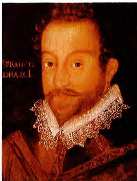
Sir Francis Drake (c.1540-1596). Atribuido a Jodocus Hondius. National Portrait Gallery, Londres.