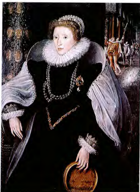
Isabel I de Inglaterra (1533-1603). Por Quentin Massys el Joven, s. xvi. Pinacoteca Nazionale, Siena.

No obstante, William Hawkins (6) proseguía activamente en Plymouth los preparativos de las fuerzas navales basadas allí. Los navíos Hope y Nonpareil estaban casi listos de carena, mientras el Revenge permanecía dispuesto para la botadura el 27 de febrero; se trabajaba de día y de noche, a la luz de antorchas y faroles, a pesar del mal tiempo reinante (7). El aumento de los costes de alistamiento de tan elevado número de navíos hizo que Hawkins se viese obligado en diciembre de 1587 a rescindir el contrato que había firmado en 1578 con la Corona inglesa para la reparación y el mantenimiento de todos los buques de la Reina por un importe de 5.714 libras anuales (8). Como consecuencia de ello, se volvió al antiguo sistema de presupuestar las obras navío por navío (9).