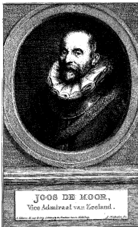
Joos de Moor. Grabado por J. Houbraken (1760).

Ante los informes recibidos que aseguraban la concentración de la armada en La Coruña y haber saltado un buen viento del norte, tras un consejo de guerra en el que sin duda Drake llevó la voz cantante, el almirante ordenó a las tres de la tarde del 17 de julio poner proa al sur, con el propósito de descubrir y atacar a los españoles. Esta decisión, que no contaba con la aprobación de la Reina ni del Consejo, adoptada en defensa de la patria a pesar de la escasez de víveres que padecían los navíos resulta cuando menos admirable y de una notable agresividad que honra grandemente a los mandos que la tomaron (77).