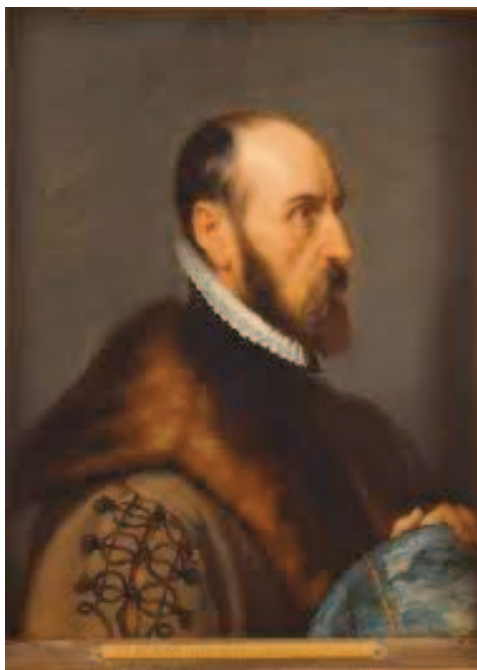
Abraham Ortelius por Peter Paul Rubens, Museo de Antwerpen (Amberes)