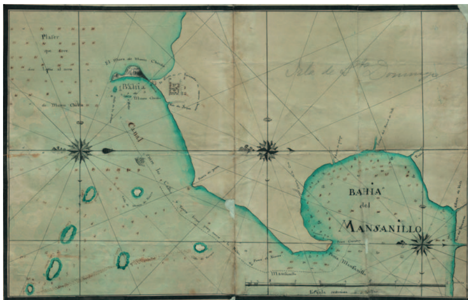
Carta náutica de la bahía de Manzanillo, en la isla de Santo Domingo. Archivo del Museo Naval de Madrid. Ubicación: DE-signatura: MN- 20-C-10

y dirigió recursos económicos a mantener el ejército que se enfrentó con el francés y que produjo mucho gasto. Algunos artilleros de mar y marineros fueron despedidos, pues la financiación del ejército se hizo en detrimento de la Armada.