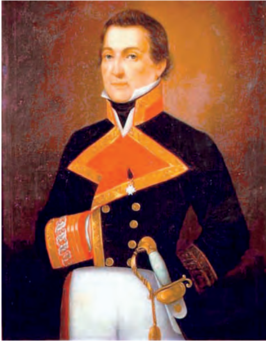
Retrato de Alejandro Malaspina y Melilupi, brigadier de la Real Armada. (Anónimo. Museo Nava).

La Armada siempre había mantenido una clara vocación científica a lo largo de la historia y había sido pionera en muchas investigaciones que se habían desarrollado en tiempos pasados; así, en 1751, casi cuarenta años antes de que Malaspina iniciara su periplo, el insigne marino y científico Jorge Juan y Santacilia, siendo capitán de la Compañía de Guardias Marinas, propuso a don Zenón de Somodevilla y Bengoechea, marqués de la Ensenada y por entonces secretario de Marina, la construcción de un observatorio astronómico en la torre del homenaje del Castillo de la Villa, en Cádiz, sede de la Real Compañía, con el objetivo de inculcar en los guardias marinas la astronomía como fundamento del arte de navegar. Esta propuesta llegó a