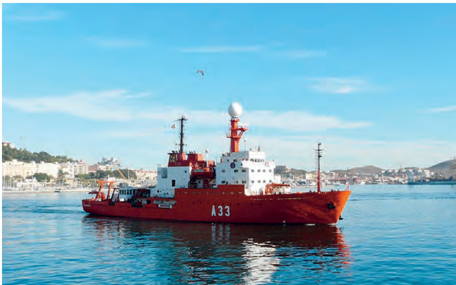
Salida Campaña Antártica 2009-10.