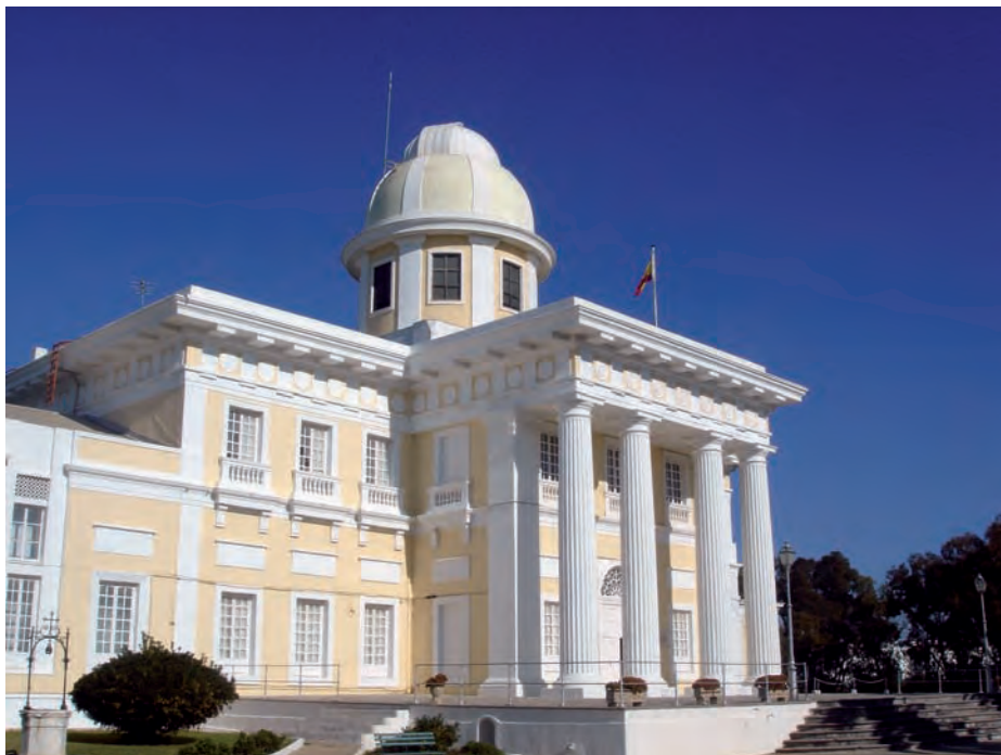
Real Instituto y Observatorio de la Armada.

parte histórica de dicha exposición y contribuirá de forma notable en su catálogo. Respecto al Instituto Hidrográfico de la Marina —como ya se ha mencionado, no hay que olvidar la condición de hidrógrafo de Alejandro Malaspina—, va a participar en los eventos que se organicen en Cádiz durante su despedida institucional, después de su salida de Cartagena el día 11 de diciembre de 2010, y además colaborará en la elaboración de los paneles para la exposición itinerante a bordo del BIO Hespérides que se desplegará en los diferentes puertos.