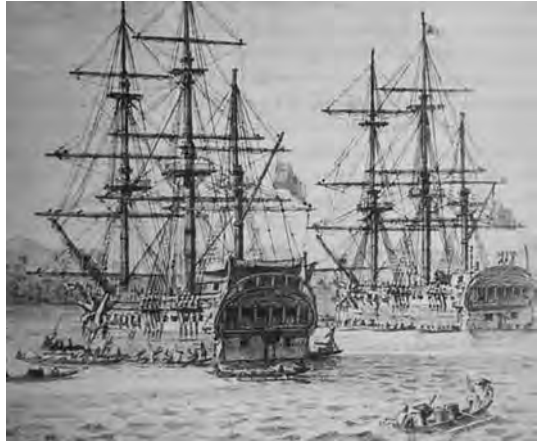
Corbetas Atrevida y Descubierta.

En junio de 2005 el Gobierno presentó el Programa INGENIO 2010 como una iniciativa que tenía como objetivo estratégico la plena convergencia con la Unión Europea en el año 2010 en varios aspectos, entre ellos, el de la sociedad del conocimiento. Además de mantener todos los esfuerzos ya existentes en el terreno de I + D + i, mediante esta iniciativa se pretendía involucrar al Estado, la empresa, la universidad y los organismos públicos de investigación en un esfuerzo