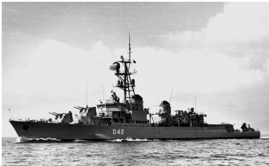
Destructor Roger de Lauria (D-42) de la clase Oquendo . (Foto: wikipedia.org).