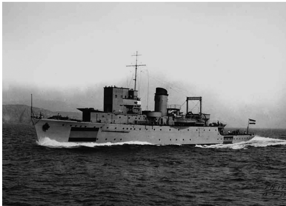
Pruebas del Eolo , 13 de septiembre de 1941.

Los minadores de la clase Eolo habían sido encargados por O. M. de 21 de marzo de 1936 del Gobierno de la República, constituyendo el último pedido de la Armada a la SECN antes de la rescisión del contrato derivado de la Ley Maura-Ferrándiz de 1909, y serán los primeros buques entregados por el Consejo Ordenador tras el final de la guerra.