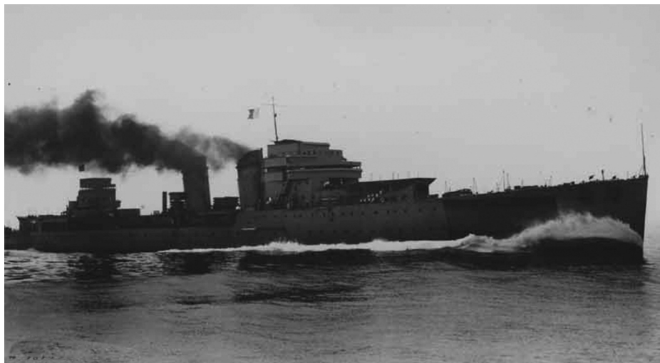
Crucero Galicia transformado. Pruebas, 24 de julio de 1944.

con un Heinkel (He-114) instalado sobre calzos, pues el hecho de no haber podido fabricar ni importar de Alemania las correspondientes catapultas reducía su operatividad a condiciones de mar prácticamente llana.