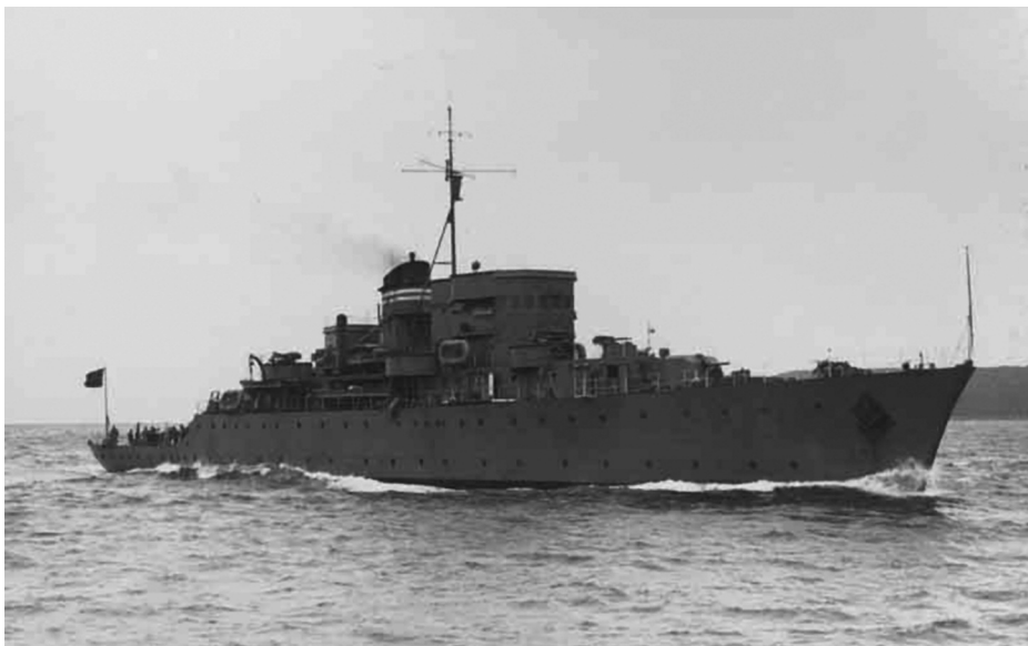
Cañonero Hernán Cortés en pruebas, 4 de julio de 1947.

Esta clase constituyó la primera serie importante proyectada y ordenada tras la Guerra Civil. Estuvo inspirada en la clase británica Loch , precedida de otras de carácter antiaéreo, que fueron las que inspiraron el diseño de la primera serie de esta clase. Sin embargo, la fuerte amenaza submarina alemana hizo necesaria la defensa antisubmarina de los convoyes del Atlántico y se