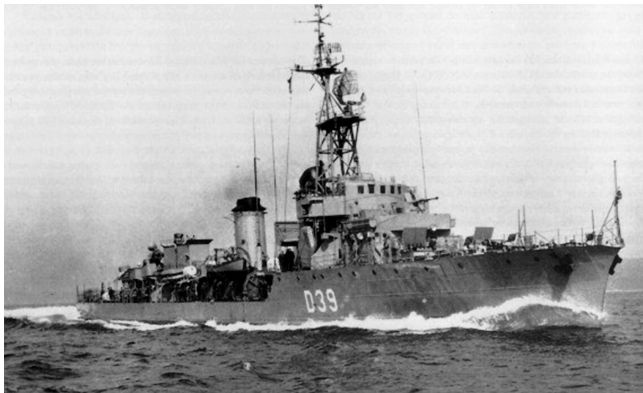
Relámpago.