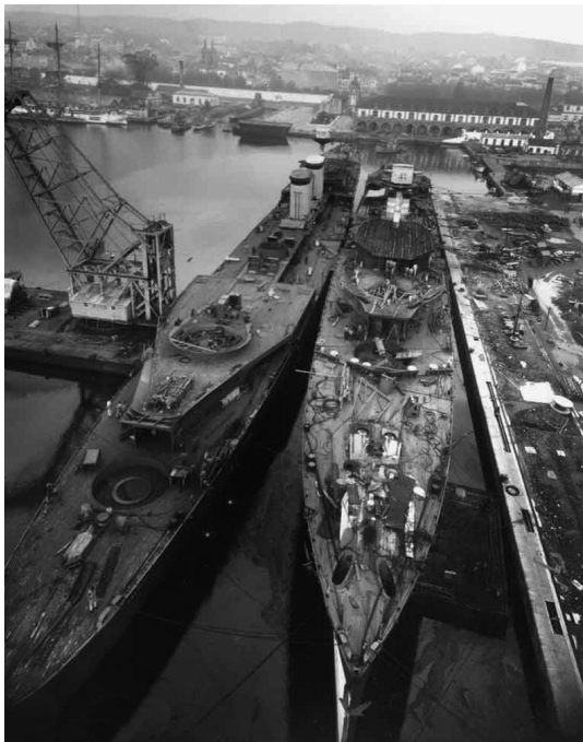
Cruceros Galicia y Cervantes en el Muelle N.