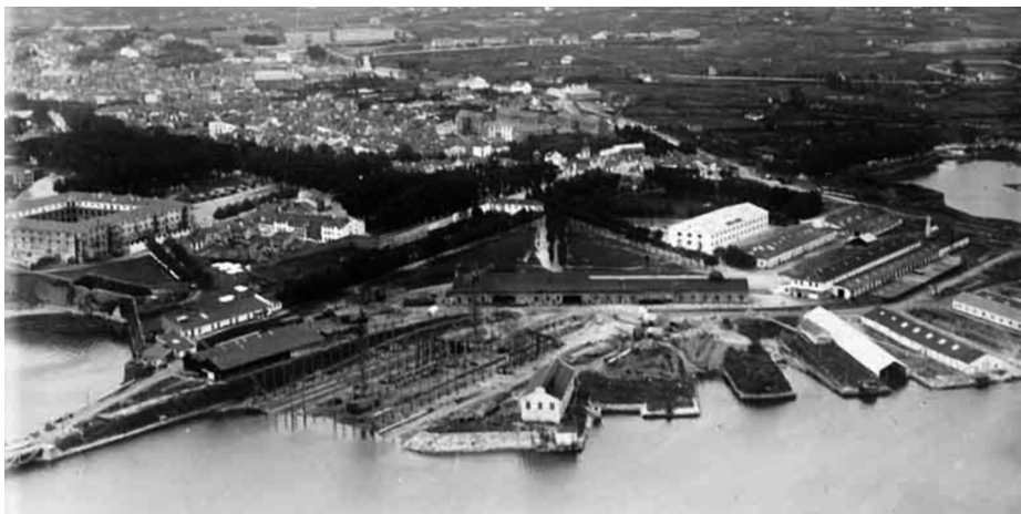
Vista aérea del Astillero de Ferrol.

situación preparándose para el desguace y también al destructor Velasco , en reparación en el arsenal; se terminaron tres de los cuatro minadores de la serie Júpiter ; se transformó el República (ex- Reina Victoria Eugenia ) en el Navarra ; se recuperó el Císcar , que había sido previamente reflotado en El Musel, donde había sido hundido por la aviación nacional; se armaron los bous y los cruceros auxiliares (30 buques en total), entre los que destacó el apresado Mar Cantábrico y, además de todo eso, se elaboró una buena cantidad de munición y diversas clases de elementos imprescindibles para el Ejército (2).