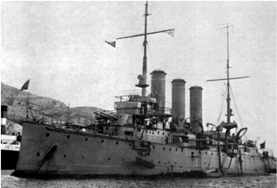
Crucero Reina Regente ..