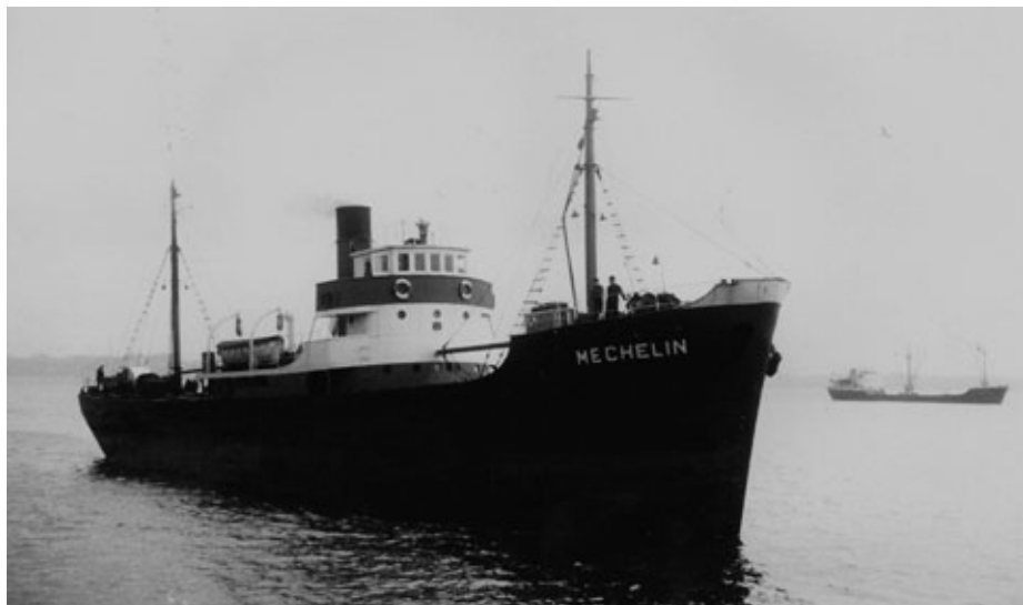
Imagen del Mechelín en Santander. (Foto: Blánquez).

primeros del año 1961 no se resolvió el expediente de remolque número 382-56 con las indemnizaciones y el precio a recibir por el armador y la tripulación del Bahía de Cádiz por la asistencia prestada al Mechelín .