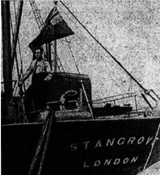
Detalle de la popa del Stangrove en plena Guerra Civil.