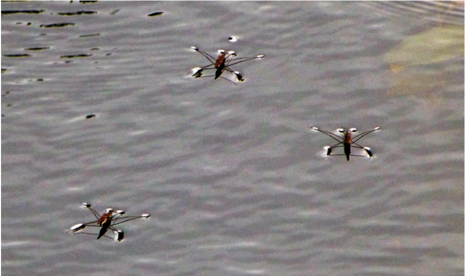
Un «zapatero» de agua dulce, muy parecido a los halobates marinos. Foto tomada por el autor en la laguna de Cospeito, Lugo, en mayo de 2014.

cuenta en todo el mundo el género Halobates , animalillos acuáticos que todos conocemos con el nombre de «zapateros» y que seguro que os han llamado la atención al verlos «patinar» sobre la superficie acuática de ríos y lagunas porque sus patas están diseñadas para poder levitar sobre la tenue barrera que ofrece la tensión superficial del agua. Os adjunto la fotografía de un «zapatero» de agua dulce tomada por mí en la luguesa laguna de Cospeito hace unos pocos meses para que os sirva de referencia.