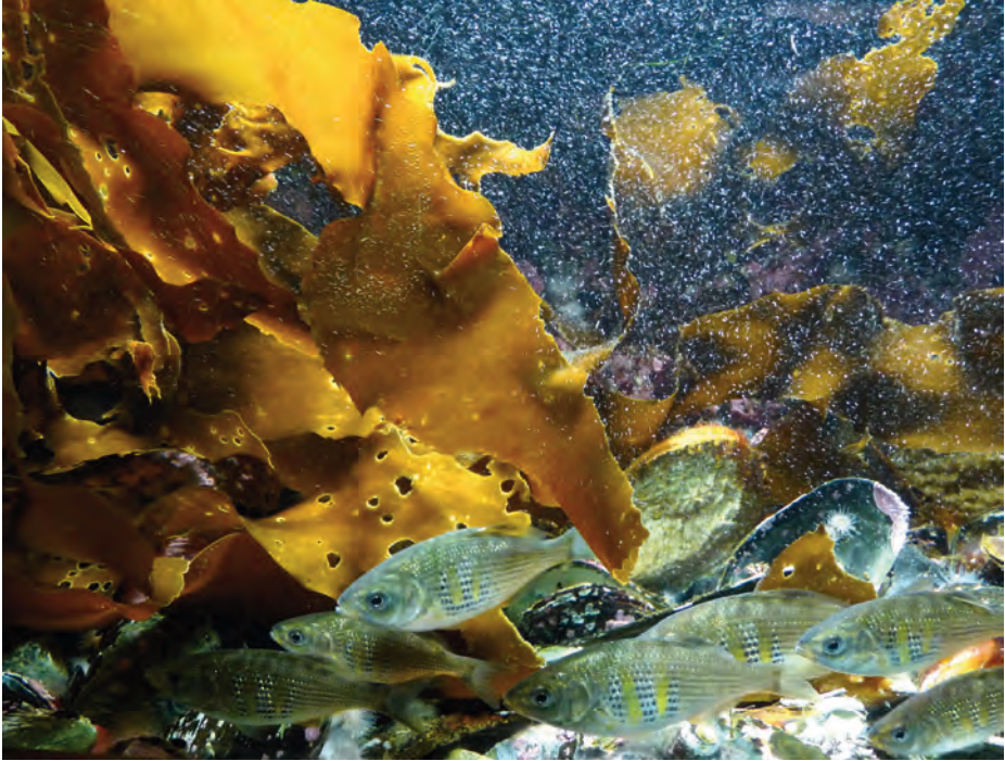
Seres bentónicos y al fondo una «nevada» de diminutos organismos planctónicos que, al ser tan visibles, creemos que pueden ser copépodos. En primer término, peces nectónicos.

primarios, o sea, serían en la mar los verdaderos e indiscutibles herbívoros del plancton, los primeros de la pirámide trófica, capaces de transformar los hidratos de carbono de diatomeas y dinoflagelados en proteína animal. Su número es incalculable. El citado autor considera que uno solo de ellos, del género Calanus , es el microorganismo más abundante del zooplancton y no se arruga al afirmar que representa la mayor biomasa total de toda la mar, únicamente sobrepasada, pero solo en determinados lugares —matiza—, por la de los eufasiáceos, ya sabéis: el desbordante krill. La biomasa de los copépodos se dispara, además, porque cuenta con una vida larvaria, también nadadora, de tipo nauplius , que aumenta tanto su concentración en el plancton que sobra para alimentar, entre otras, a las especies pesqueras más populares: arenques, bacalao y afines, y sardinas y anchoas, que también son ciento y la madre. También a ballenas y tiburones filtradores de agua. Y por si era poco Calanus tiene hasta tres generaciones por año, y eso no es nada si lo comparamos con otro copépodo más pequeño, Tisbe furcata , del que Gunnar Thorson afirma