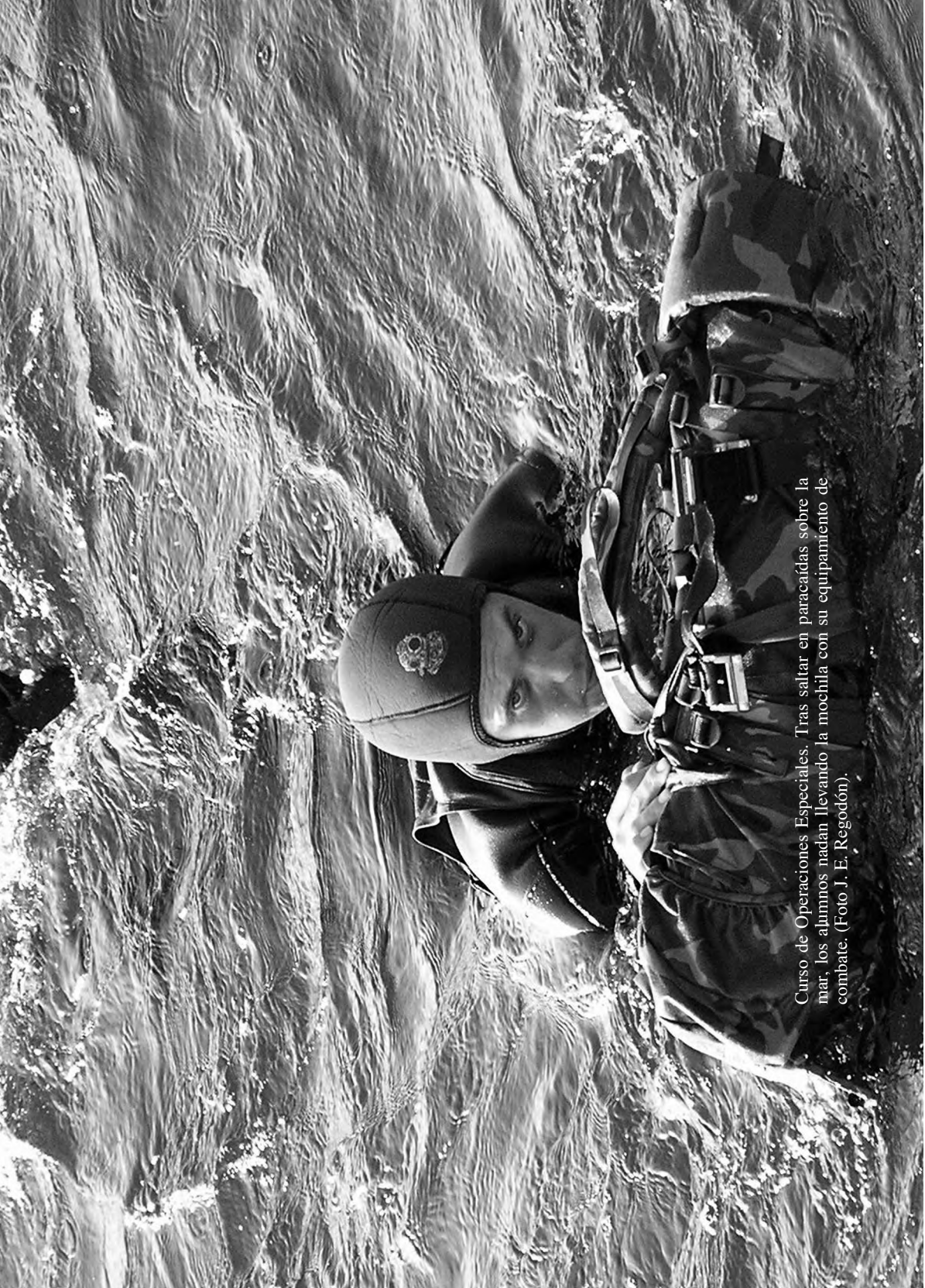
Curso de Operaciones Especiales. Tras saltar en paracaídas sobre la mar, los alumnos nadan llevando la mochila con su equipamiento de combate.