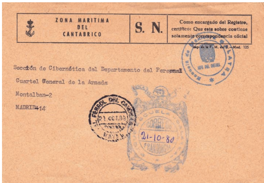
Sobre del S. N. de la Z. M. del Cantábrico, circulado a Madrid el 21 de octubre 1980 con fechador de El Ferrol del Caudillo-Naval, sello administrativo del jefe del detall y franquicia de Correos del buque escuela de maniobra Galatea. En esa época, ya había sido desalojado.