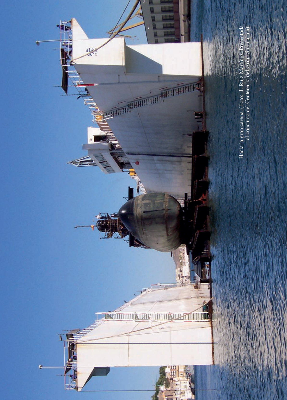
Hacia la gran carena. (Foto: J. Ruiz Martínez. Presentada al concurso del Centenario del Arma Submarina).