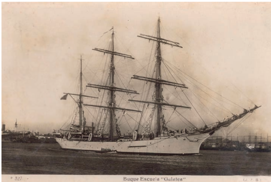
Tarjeta postal de época, en blanco y negro, usada como modelo para el cuadro.

tea) causará baja en la lista de unidades del Tren Naval el día 30 de Diciembre de 1982. — 2- El desarme se llevará a cabo en el Arsenal de El Ferrol...».