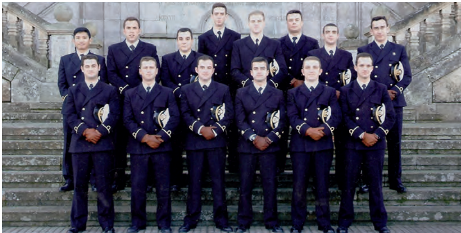
Escuela Naval Militar: alféreces de fragata (2004) procedentes de la Escuela Preparatoria del CHA.

Los mejores resultados cuantitativos de CHA-MADRID tuvieron lugar en 2008 con un 52,48 por 100 de ingresados en los diferentes Cuerpos de las Fuerzas Armadas. Por otra parte, los mejores resultados cualitativos tuvieron lugar en la oposición de 2006, con las plazas 1 y 2 del Cuerpo General de las Armas (ET), las plazas 1 y 2 del Cuerpo General de la Armada, la plaza 1 de Infantería de Marina y la plaza 2 del Cuerpo General del Aire. A lo largo de la década, las oposiciones que precisaron de una mayor puntuación para acceder a las mismas fueron Guardia Civil y Cuerpo General del Aire.