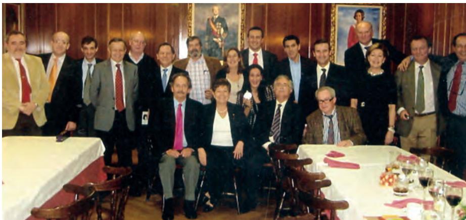
Profesorado de la Escuela Preparatoria del CHA de la década de 2000 en la cena de despedida en la cámara de la JUCEN.