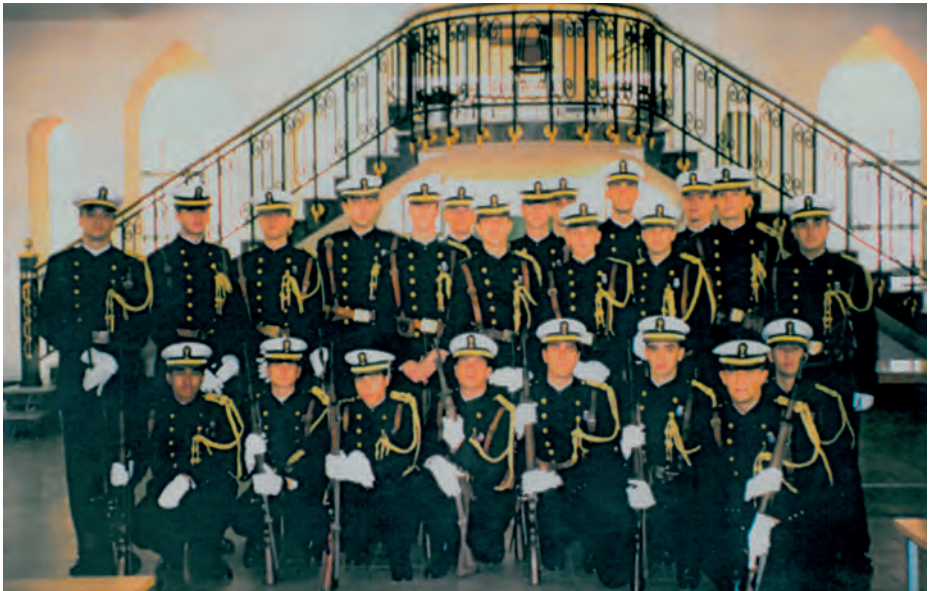
Grupo de alumnos de la Escuela Preparatoria del CHA de la promoción de 1988.

Del estudio de las tablas de la páginas siguientes se pueden extraer las siguientes conclusiones: