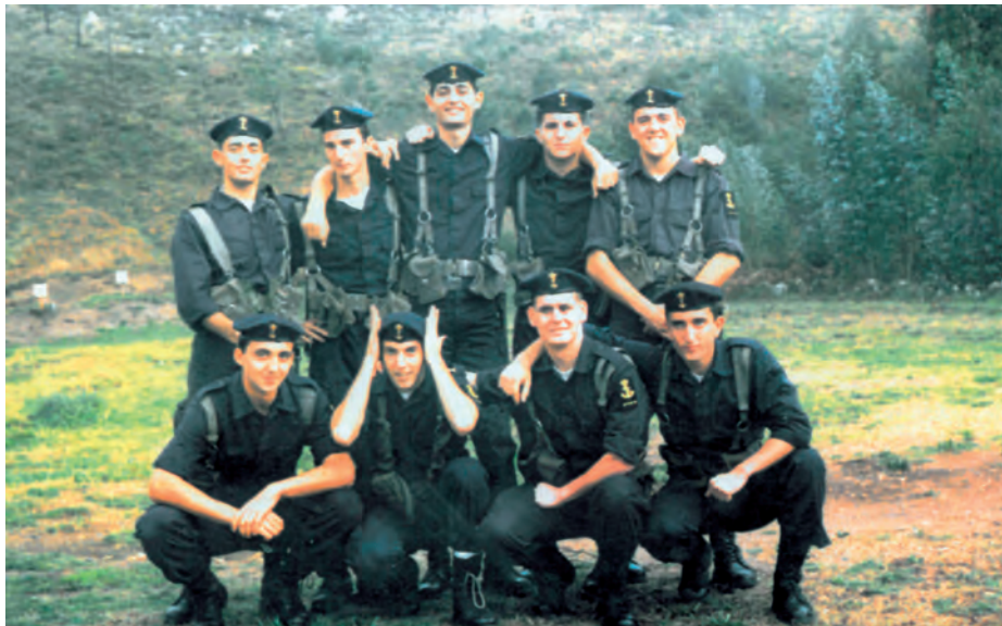
Alumnos del CHA de la promoción de 1993.