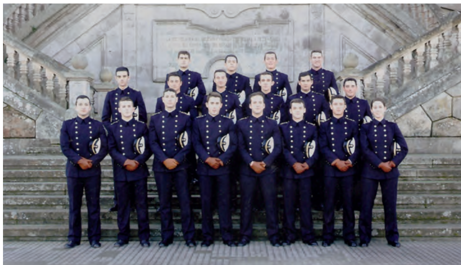
Escuela Naval Militar: aspirantes de 2.º (2004) procedentes de la Escuela Preparatoria del CHA.