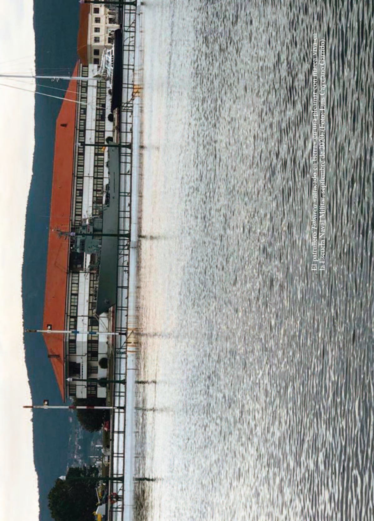
El patrullero Tabara «atracaado en tierra» en una pleamar con marea viva en la Escuela Naval Militar, septiembre de 2020. (Foto: Luis Cayetano Garrido).