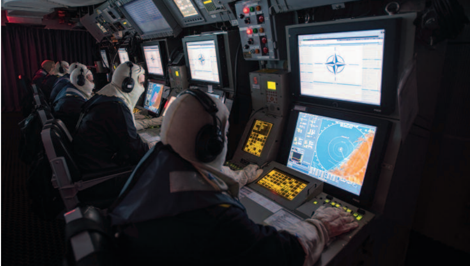
CIC de la fragata Álvaro de Bazán . (Foto: www.flickr.com/photos/HQ_Marcom ).

no es más que la última evolución de la NCW. Esta requiere interconectar todos los sensores desplegados en la zona de operaciones y disponer de gran capacidad de cálculo en los centros operacionales en tierra, lo que nos permitirá tomar decisiones más allá de la capacidad humana, aplicando la tecnología del internet de las cosas y la inteligencia artificial.