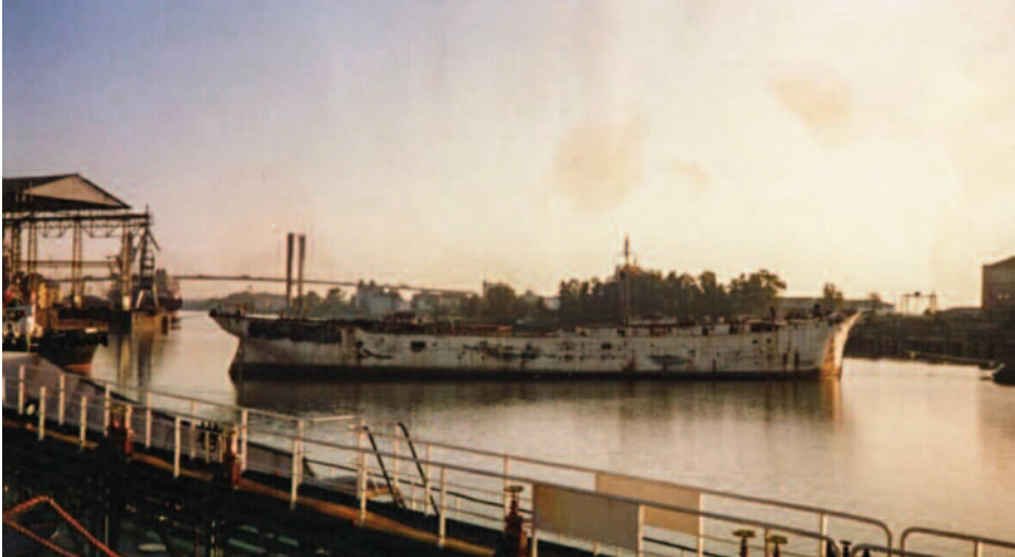
Maniobra de salida del Galatea de las instalaciones de Sevirtrade, en el Puerto de Sevilla.

Ante la imposibilidad del Patronato de San Telmo de conseguir las cantidades necesarias, el 16 de enero de 1990 dicha institución acabó rescindiendo el contrato con el Estado, volviendo así a manos del Ministerio de Defensa. El Galatea en Sevilla pasó de la gloria de las páginas de los periódicos al purgatorio del carpetazo.