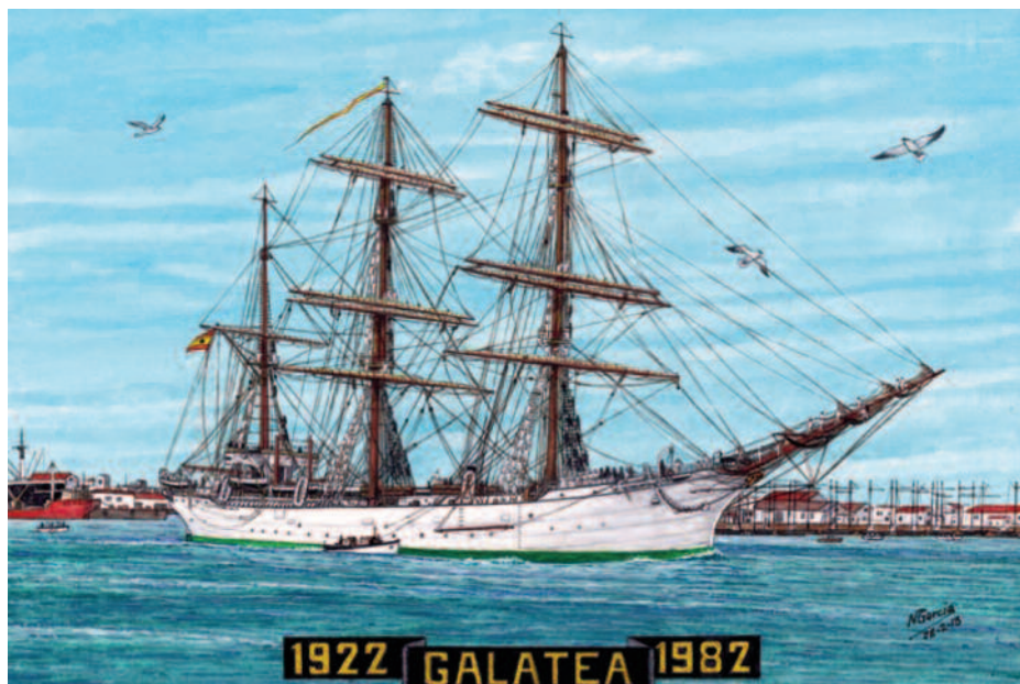
(Manuel García García. Colección RGM).

Redactamos este artículo precisamente en el año 2020, en el que otra embarcación a vela, la réplica de la nao Victoria , ha tenido el honor de ocupar el puesto que iba a tener el Galatea . Desde el pasado mes de marzo dicho barco se encuentra atracado junto a la Torre del Oro, donde sirve como complemento del Centro de Interpretación de la Primera Vuelta al Mundo. ¿Se imaginan la estampa de los dos veleros desde el puente de Triana en un entorno con tanta señera?