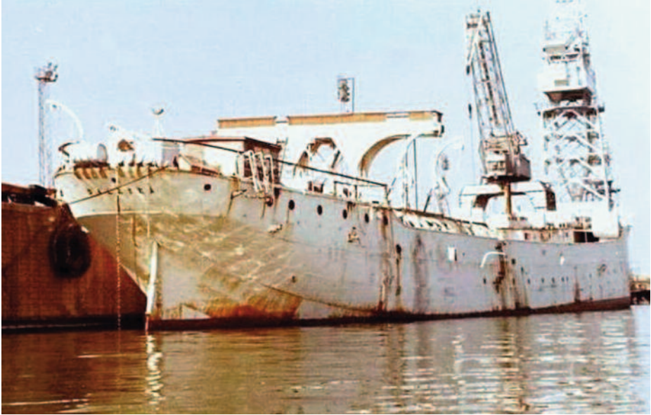
Vista de popa del Galatea atracado en la parte del muelle de la Esclusa correspondiente de Astilleros de Sevilla a su llegada a la capital. (Foto: http://www.nauticadigital.com/marina/el-buque-escuela/ ).

«El estado del buque es francamente deficiente; tengamos en cuenta que, aunque fue reparado hace año y medio, los remaches en un importante porcentaje no están en condiciones... Dada la importante cantidad de grietas y perforaciones que encontramos, se puede temer la posibilidad de que la fatiga del material conduzca a fracturas de tipo frágil, que se ocasionarían con cargas bastante por debajo del límite elástico» (16).