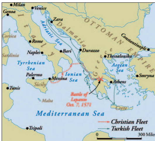
Movimientos generales de las flotas.

Gomeriza era un buen fondeadero para comprobar la situación operativa de las galeras, pero Juan de Austria no podía pasar revista a la totalidad, por lo que comisionó al comendador de Castilla y a Juan Andrea Doria. Veniero se negó a que este último pusiera el pie en ninguna de