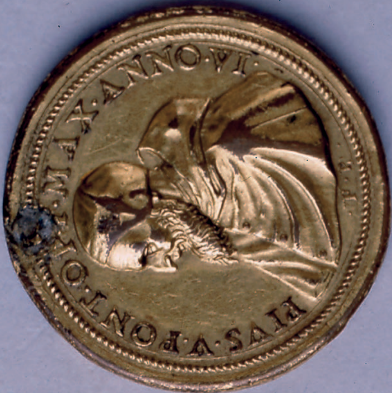
San Pío V. Medalla conmemorativa de la batalla naval de Lepanto. (Museo Naval de Madrid)