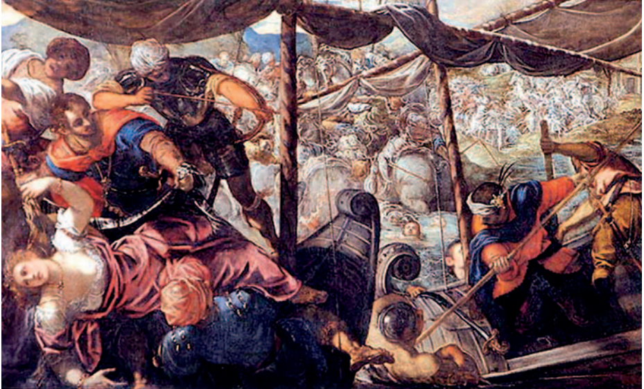
Lucha entre turcos y cristianos en el asedio a Famagusta, pintada por Tintoretto.

entrega del estandarte e insignias de la Santa Liga, que debería arbolar cuando las fuerzas navegaran reunidas. En el pendón figuraban las armas de las tres naciones, tal como lo dispuso Pío V. El día 14 se celebró en la iglesia de Santa Clara una fiesta religiosa en la que recibió Juan de Austria el bastón de mando (conjunto de tres báculos ligados) de capitán general. Acabada la entrega, se trasladó el estandarte a la galera Real , que fue saludada por todas las demás con artillería y arcabucería.