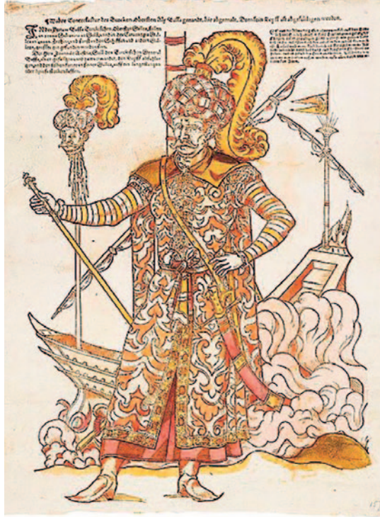
Alí Pachá.