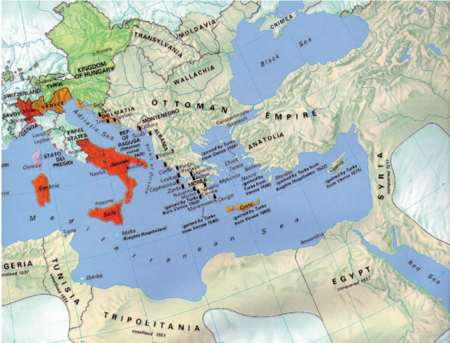
En 1571 la extensión del Imperio otomano, y por ende del islam, representaba una tenaza a punto de cerrarse sobre Europa. (Facilitado por el autor)

elemento que alimentaba la esperanza de los temerosos cristianos ante la nueva y decidida amenaza del Imperio otomano era la enérgica figura de Juan de Austria.