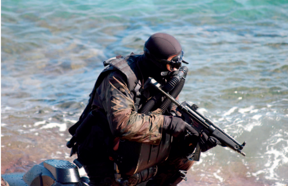
Infante de Marina de Operaciones Especiales en la actualidad.

Tras la evaluación del ejercicio se determinó que se realizó con pleno éxito, si bien las bajas resultantes estimadas eran considerables, debido princi-