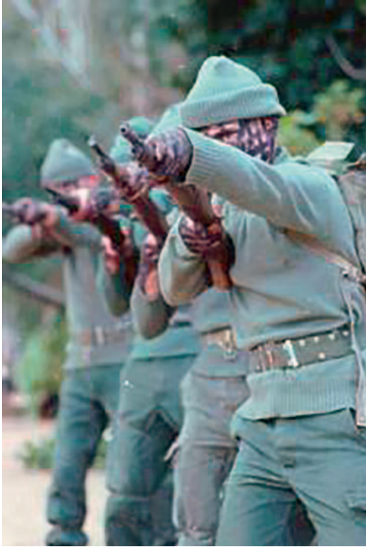
Boinas verdes de la UOE realizando ejercicios de esgrima de fusil.

que, en principio, todos ellos integrantes de las dotaciones de los destructores de la 2. a Flotilla.