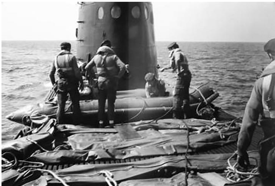
Boinas verdes alistando embarcaciones sobre cubierta de un submarino.

anfibia para la demolición de objetivos, tanto terrestres como a flote; eliminación de defensas submarinas; superación de todo tipo de obstáculos que pudieran exigir largas marchas por terrenos abruptos, incluso escalada; supervivencia, entre otros.