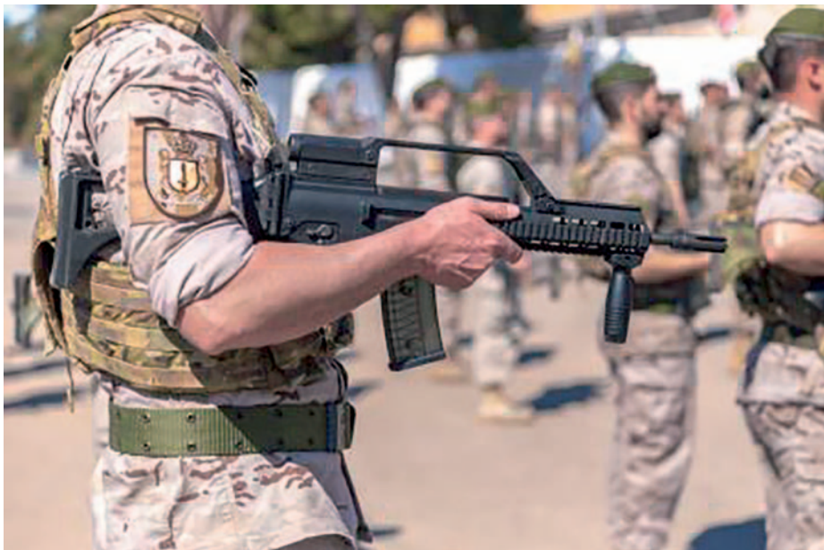
Estol de la FGNE.

y mechas; cinco cabos de gancho; cinco hachas-pico de mango pequeño; un radioteléfono de micro válvulas; 11 cajitas botiquín, conteniendo vendas, gomas y desinfectantes; un encerado y una escala de gancho de seda de 10 metros. En cuanto a la dotación de munición, ocho peines por subfusil y ocho peines por pistola-ametralladora.