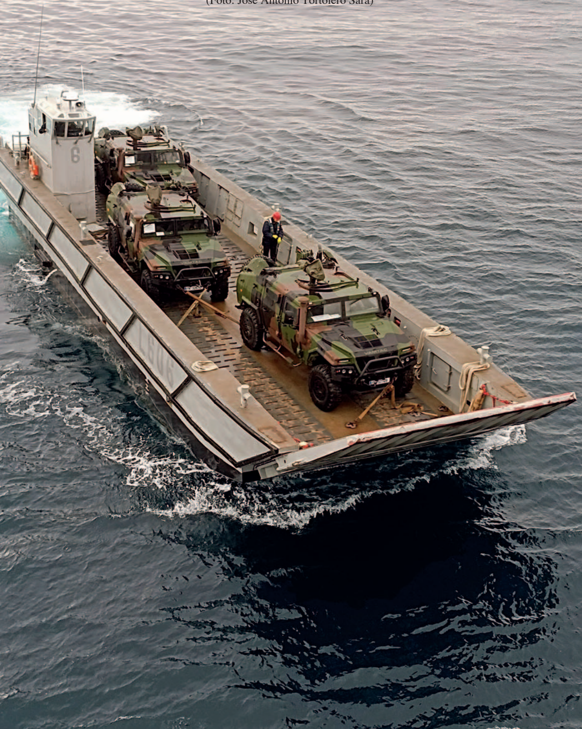
Una LCM-IE durante el Ejercicio GRUFLEX-22 desembarcando vehículos tácticos de alta movilidad, marzo de 2022.