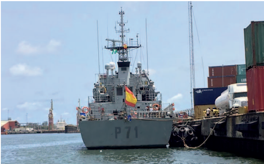
Patrullero Serviola .

Una gran parte de la cocaína que se consume en Europa entra por la costa sur de España (EMCDDA, 2019: 137). Las carreteras del desierto de Mali y de Marruecos son su antesala (Sangaré, 2019: 38). La vía marítima es la principal forma de transporte desde el norte de África hasta Europa (EMCDDA, 2016: 2) y tanto África occidental como el Magreb son importantes zonas de tránsito para la cocaína que llega a nuestro continente (EMCDDA, 2019b: 28; El Yattoui, 2019: 5; EMCDDA, 2019a: 136). Por el Sahel occidental transita más del 15 por 100 de la producción mundial de cocaína y es su principal puerta de entrada a España (Mezzofiore, 2014). En la actualidad, muchos investigadores de habla francesa defienden que nuestro país constituye el acceso más importante de esta droga a Europa, y afirman que una de las rutas primordiales que emplean los narcotraficantes desde el continente sudamericano es aquella que recalca en la costa de los países de África occidental (Guinea-Bisáu, Ghana, Senegal y Benín) para luego remontar este continente a través de Mali y Níger en demanda de las costas de Marruecos y Argelia, desde donde transitarían en narcolanchas hasta el litoral sur español (Tinti, 2020: 11; Peduzzi, 2010: 5; Gayé, 2018: 10; Brun, 2019: 380; Chouvy, 2020: 38; Chandra, 2020: 70; Thioly, 2013). Por su parte, EUROPOL sostiene que una de las principales formas de entrada de cocaína en Europa tiene lugar por vía aérea desde Marruecos. Previamente, las redes basadas en este país