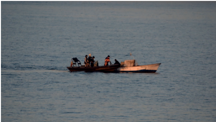
Embarcación del patrullero Serviola de la Armada interroga a una lancha en aguas del mar de Alborán próximas a la ciudad española de Melilla.

reciben los cargamentos de cocaína sudamericana desde el Sahel (EUROPOL, 2021c: 48). La Oficina de las Naciones Unidas contra la Droga y el Delito (UNODC) confirma que la ruta africana de la cocaína hacia Europa continúa muy activa (UNODC, 2020: 30).