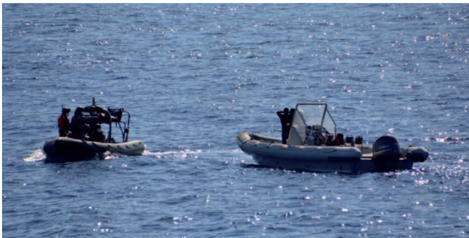
Una embarcación del patrullero Serviola de la Armada detiene a una lancha sospechosa de traficar con drogas en aguas del mar de Alborán.

Aunque las Fuerzas y Cuerpos de Seguridad de los Estados de esta región consigan detener a los narcotraficantes, las posibilidades de que sean juzgados y declarados culpables son bastante bajas. Es más, hay países africanos que después de detener a los sospechosos se ven obligados a dejarlos en libertad por falta de espacio en sus cárceles (Brun, 2019: 144).