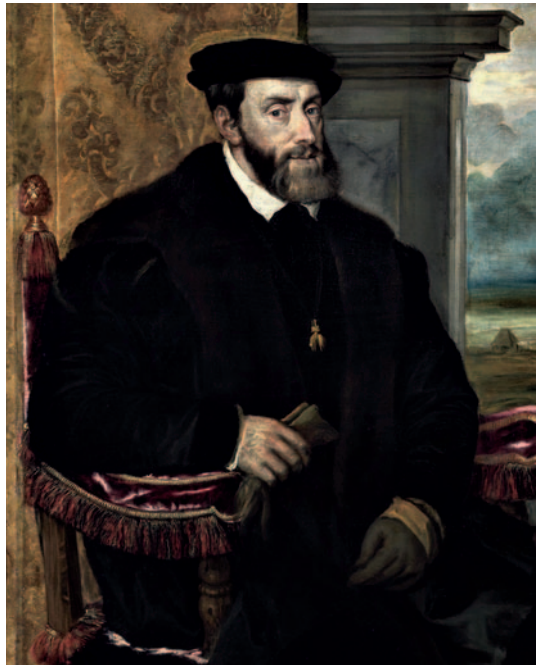
El emperador Carlos V retratado por Tiziano.

En 1517 surge un hecho religioso —la protesta de Martín Lutero contra la venta de indulgencias concedidas por León X para construir la basílica de San Pedro— que tendrá una repercusión política impensable. A ello siguió una escalada en la polémica del monje alemán con la Santa Sede, lo que derivó en su excomunión en 1521. Lo que hubiera podido quedar como un conflicto religioso interno saltó a la política cuando Carlos I declaró su fidelidad a Roma y se erigió en defensor de la unidad religiosa con la fuerza de las armas. Mientras tanto, los príncipes alemanes se alinearon con la Reforma de Lutero pues, aparte del hecho religioso, el monje publicó un escrito apoyándoles en su lucha para el sometimiento de los campesinos. La Dieta de Augsburgo de 1530, último intento para volver a la unidad, confirmó la ruptura entre católicos y protestantes, lo cual sería un motivo más que avivaría el conflicto político y bélico en Alemania y Flandes. Años después, el archiduque Fernando de Austria, más pragmático que su hermano Carlos I, firmaría el decreto de paz en Augsburgo en 1555, declarando la libertad religiosa para los