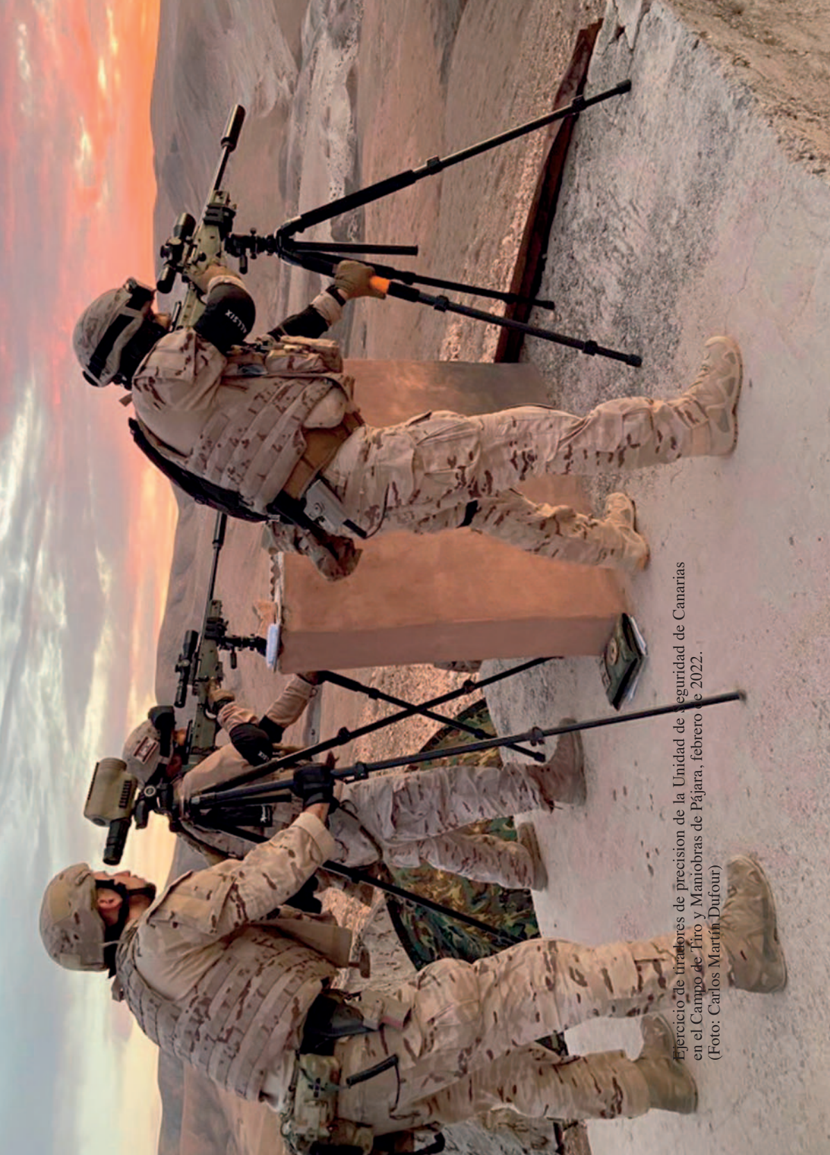
Ejercicio de tiradores de precisión de la Unidad de Seguridad de Canarias en el Campo de Tiro y Maniobras de Pájara, febrero de 2022.