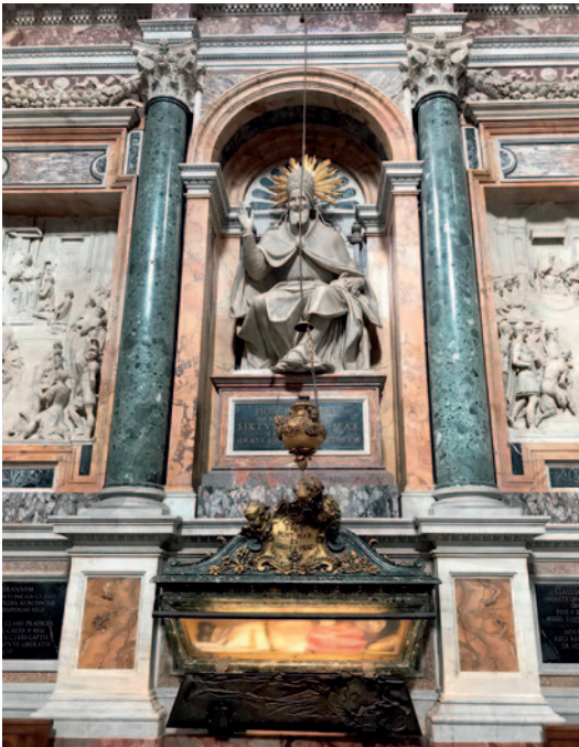
Tumba de San Pío V en la Capilla Sixtina de la Basílica de Santa María la Mayor en Roma.

El 13 de septiembre de 1569, un hecho fortuito cambiaría por completo el panorama. El estallido de una fábrica de pólvora en Venecia provocó un gran incendio que destruyó numerosas casas, así como cuatro galeras del arsenal. La noticia que llegó a Estambul, por medio de los espías, fue que la mayor parte de su flota había quedado destruida. Era una ocasión que no podía desaprovechar el sultán Selim II, quien exigió la entrega de la isla de Chipre. Venecia intentó infructuosamente negociar ofreciendo un tributo económico pero, al no entregar la isla, la amenaza se cumplió. El 27 de julio de 1570, la flota de 250 naves del almirante Pialí Pachá desembarcó en Lánarca un ejército de 60.000 hombres. El 7 de septiembre, Nicosia, la capital, en el centro de la isla, se rindió ante el invasor, que ya sumaba 100.000 hombres,