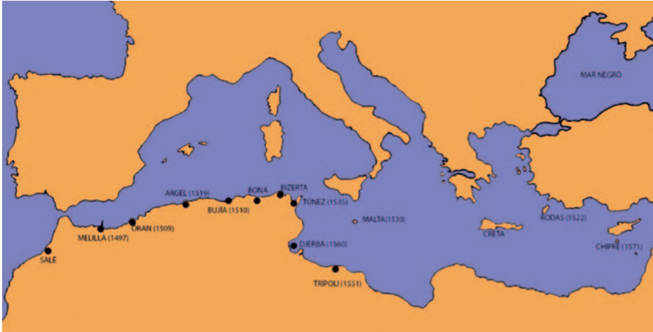
Operaciones de España en el norte de África y puntos de conflicto con los turcos y sus aliados.

incursiones, cada vez más frecuentes, saqueaban las propiedades y se llevaban cautivos a hombres, mujeres y niños. A consecuencia de ello, sus habitantes abandonaron las franjas costeras y se concentraron en el interior, mientras se levantaban torres de vigilancia costeras para que dieran aviso del acercamiento de las naves enemigas.