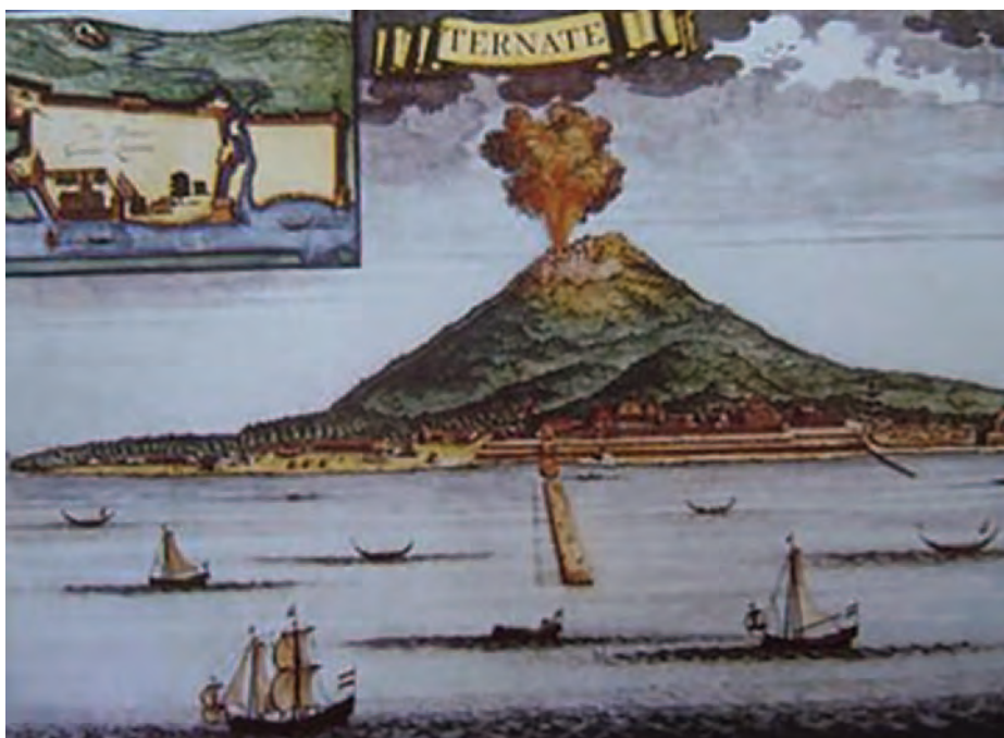
Ternate vista desde la vecina Tidore.

Zarparon las tres naves supervivientes de Cebú (1 de mayo de 1521) y, cuando estuvieron libres de «puntas y bajos» y tranquilos por no percibir ya amenaza enemiga, volvieron a elegir (democráticamente) a sus jefes. Carvalho fue designado capitán general, insignia en la Trinidad . Espinosa pasó a montar la Victoria y Elcano la Concepción , prestando los tres juramento de fidelidad al