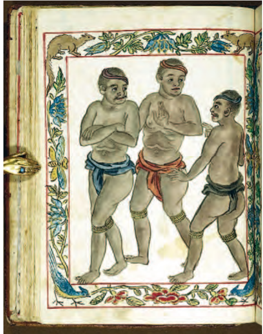
Nativos de las Molucas (2)

y continuó a Timor, divisando cientos de islas, difíciles de identificar hoy en día por lo cambiante de la semántica en tierras donde han convivido razas y religiones diversas, diferentes culturas y distintos colonizadores. Pigaffeta anotaría en italiano los sonidos que escuchaba a los nativos, pero españoles, portugueses, ingleses y holandeses lo harían en sus propias lenguas. Él cita Cayoán, Laigoma, Sico, Giogi, Cafi, Laboán (hoy parte de la isla de Bachián), Latalata, Jaboli, Mati, Batutiga, Lamatola y Tenetum. Otras islas son más conocidas y más fáciles de identificar, como Buru «a 3° -30' de latitud S y 75 leguas de Tidore», Ambón (Amboina, Kota Ambón) «a diez leguas al W de Buru» y que confina con Gilolo (Jilolo o Halmahera). A 35 leguas de