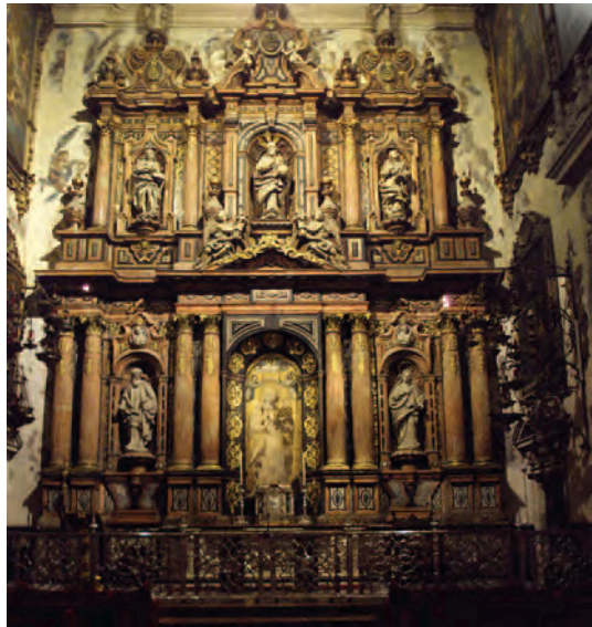
Capilla de Santa María de la Antigua (Catedral de Sevilla).

Tras el fondeo en Sanlúcar, río arriba hasta Sevilla y, a causa del catolicismo sin el cual no pueden explicarse muchas cosas de esta gran odisea, y tal como había hecho Magallanes antes de salir de allí al encomendarse a Nuestra Señora de la Victoria, en la capilla de Santa Bárbara de la iglesia de Santa Ana de Triana (por entonces capilla exenta), Elcano y los suyos fueron a postrarse a la santa iglesia catedral ante la imagen de Nuestra Señora de la Antigua que en ella se venera.