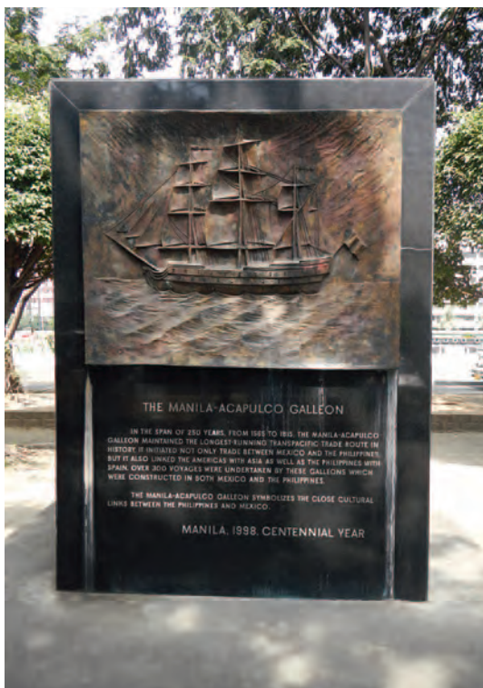
Monumento al Galeón de Manila en Acapulco.

que una galera, pero tenía más eslora y puntal que una nao, aunque era menos redondo. Se puede considerar que era un diseño propio español, pudiendo reseñar al San Diego , que en 1600 repelió en la bahía de Manila el intento del almirante pirata holandés Olivier van Noort, que al frente de tres buques pretendió asaltar la ciudad para saquearla. El San Diego consiguió rechazar el ataque y los piratas holandeses se retiraron sin atacar Manila, si bien el galeón como resultas de una vía de agua se perdió al regresar a puerto. El diseño del galeón español fue copiado por todas las marinas europeas, destacando el veneciano, diseñado para navegar por el Mediterráneo; el inglés, cuya mejor muestra fue el Ark Royal , de 880 t y 30 bocas de fuego, y el holandés, con una obra muerta más baja que el español y peor artillado que el inglés. En todos estos diseños