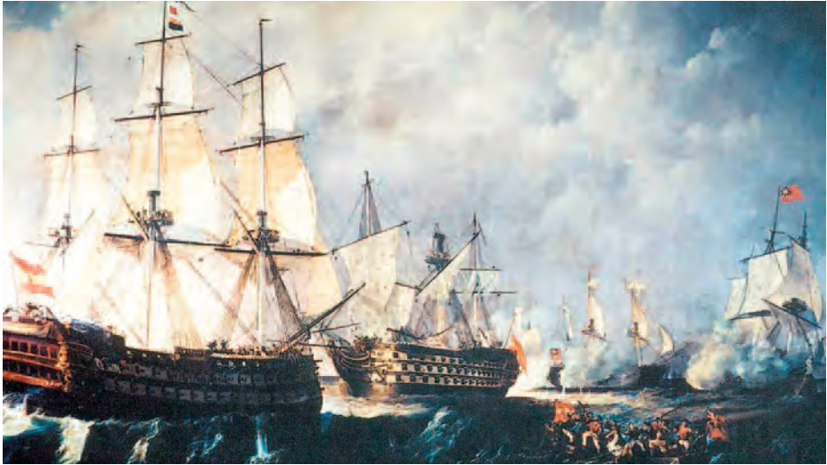
El Santísima Trinidad combatiendo en Trafalgar.