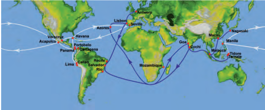
Rutas de Portugal y España, en blanco las españolas y en azul las portuguesas.