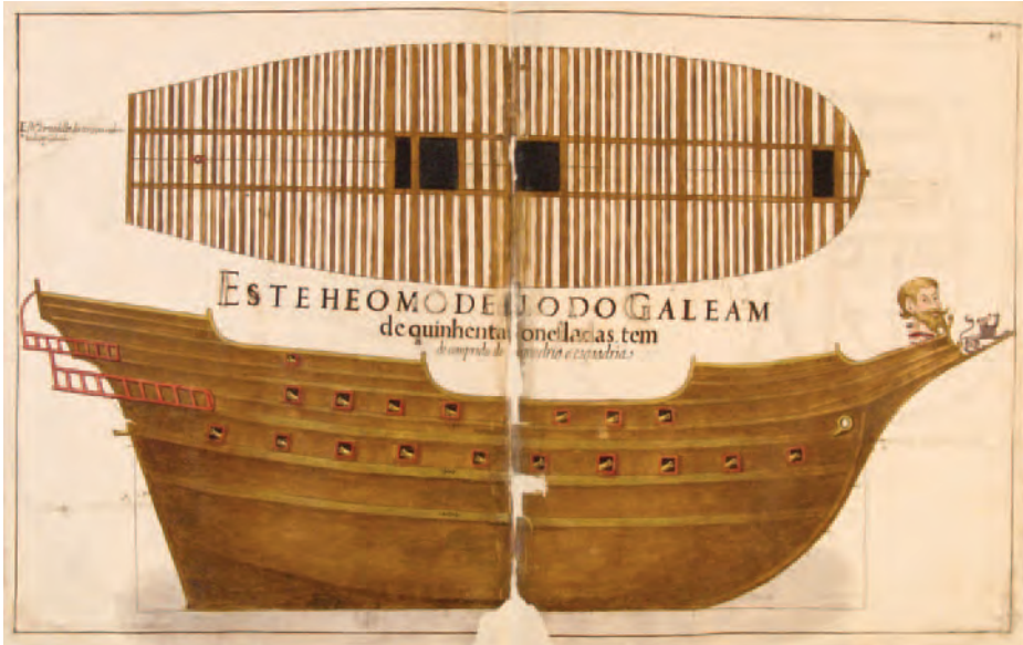
Galeón portugués de 500 toneladas. Livro de Traças de Carpintaria , Manuel Fernandes.