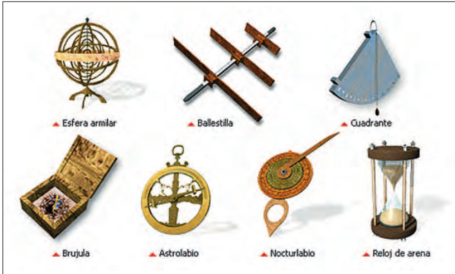
Instrumentos de navegación en el siglo XVI.

máxima añadiendo que el Imperio se perdió cuando se descuidaron la construcción de buques de guerra y el mantenimiento de las dotaciones necesarias para que España nunca dejase de ser una potencia naval de primer orden, siguiendo el ejemplo de nuestros vecinos británicos y franceses, que si bien no pueden equipararse a la Marina norteamericana, al menos se hallan en el escalón inmediato. La historia naval española no tiene nada que envidiar a la de ninguna otra marina, pero es importante recordarla y perseverar en el mantenimiento de una armada como principal elemento de disuasión frente a enemigos potenciales; como ejemplo, ante nosotros tenemos la terrible situación existente hoy día en el mar Negro, en el que una nación, invadida injustamente, carece de una marina capaz de mantener protegidos todos sus puertos por la falta de inversiones en los últimos 30 años.