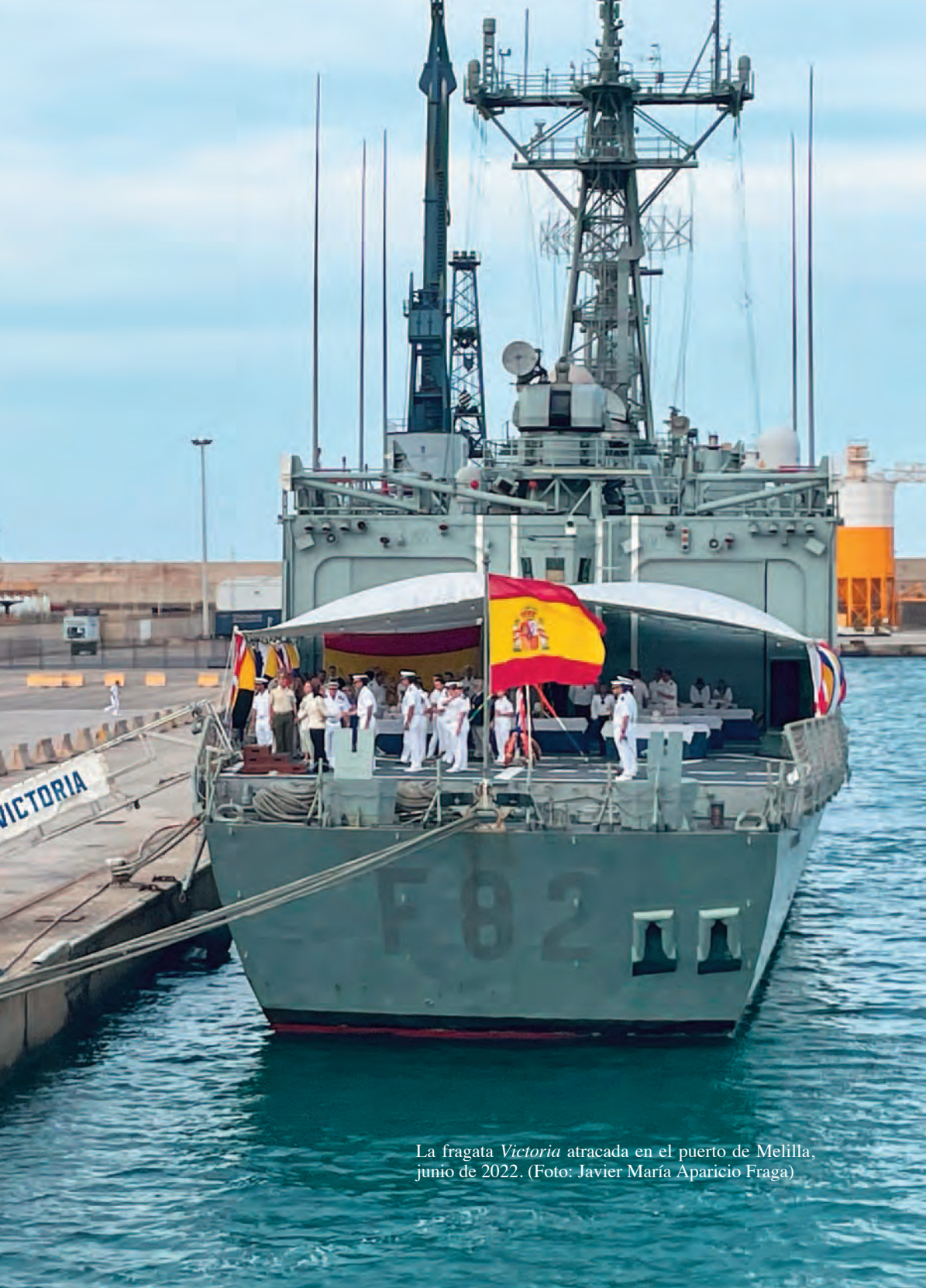
La fragata Victoria atracada en el puerto de Melilla, junio de 2022.