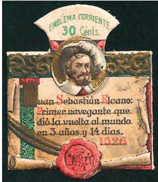
Emblema del Auxilio Social dedicado a Juan Sebastián Elcano, en el que dice que el marino tardó en dar la vuelta al mundo tres años y 14 días.

Juan Sebastián Elcano ha sido uno de los personajes representados en emblemas de 30 céntimos de peseta. Uno de ellos, dice que el marino dio la vuelta al mundo en tres años y 14 días, cuando Elcano salió de Sanlúcar de Barrameda el 20 de septiembre de 1519, y regresó al mismo puerto el 6 de septiembre de 1522, con lo que, realmente, tardó en dar la vuelta al mundo tres años menos 14 días.