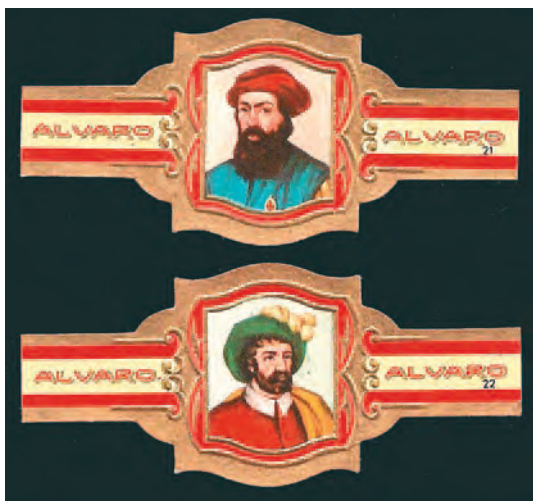
Retratos de Magallanes y Elcano en vitolas de puros de tabacos Álvaro. (Colección Marcelino González)

El tabaco, en algunos aspectos también es un vehículo de cultura, por las etiquetas de sus cajas y cajetillas, y por las variadas anillas o vitolas de los cigarros puros, cuyo coleccionismo se conoce como vitolfilia.