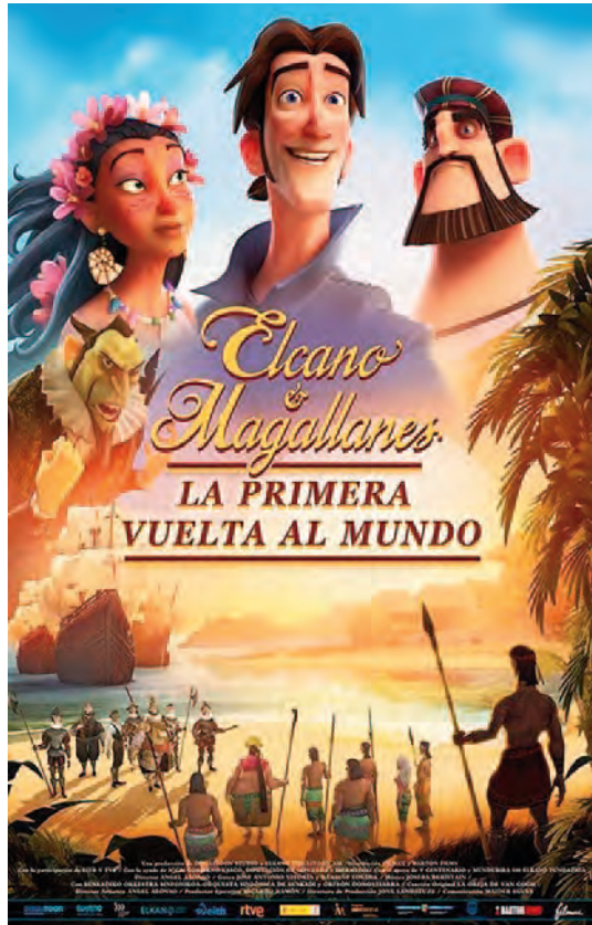
Cartel de la película Elcano y Magallanes, la primera vuelta al mundo .

La película Elcano y Magallanes, la primera vuelta al mundo , es una película española de animación, del año 2019, con una duración de 90 minutos, dirigida por Ángel Alonso a partir de un guion de José Antonio Vitoria y Garbiñe Losada. Estuvo nominada a la mejor película de animación, en los Premios Goya de 2019, los Premios Quirino de 2020, y los premios Platino, también de 2020. El