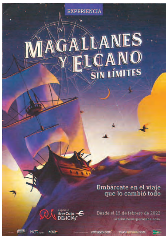
Cartel del espectáculo «Experiencia Magallanes y Elcano sin límites», presentado en el Espacio Ibercaja (Delicias, Madrid).

encontraremos con tarjetas, etiquetas, carteles, posavasos, pegatinas, anuncios y otros elementos, de los que podemos dar algunos ejemplos.