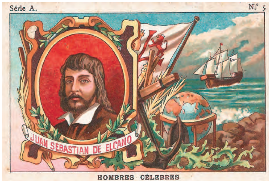
Elcano en un cromo de chocolates Juncosa. (Colección Marcelino González)

Los temas de dichos cromos coleccionables, son tan amplios como uno los pueda imaginar, pero en nuestro caso destacan los dedicados a la primera vuelta al mundo, sobre todo a Magallanes, a Elcano y a la Victoria . Como ejemplo, podemos citar las colecciones culturales de ediciones Barsal, Barcelona, con cromos dedicados a Magallanes y Elcano. Asimismo, están los cromos de colección de chocolates Juncosa, dedicados a hombres célebres, en los que aparecen ambos personajes. Magallanes, Elcano y la Victoria también aparecen en una colección publicada en 1891 por la compañía holandesa Liebig, y en otra