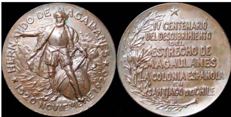
Medalla emitida por Chile en 1920 para conmemorar el IV Centenario del descubrimiento del estrecho de Magallanes

La medallística, que es una rama de la numismática, consiste en el coleccionismo y estudio de todo tipo de medallas y medallones. Normalmente se trata de discos de metal parecidos a las monedas, aunque generalmente son de mayor tamaño y con los relieves de las imágenes más pronunciados. Las hay de muchos