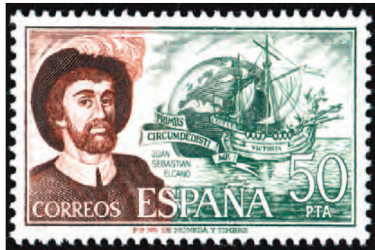
Elcano y la nao Victoria con el lema Primus circumdedisti me en un sello emitido por España el 1 de marzo de 1976.

La efigie de Magallanes ha sido motivo de sellos y hojas bloque emitidas por otros países como: Bequia y Granadinas de San Vicente, Bulgaria, Chile, Yibuti, Filipinas, Guinea Bisau, Laos, Palau, Portugal, Ruanda, Rumanía, Santo Tomé y Príncipe, Uruguay, etcétera.