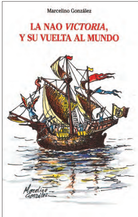
Portada del libro La nao Victoria, y su vuelta al mundo , editado en 2019

En la actualidad, es frecuente que se fabriquen objetos de cerámica o porcelana con fines puramente decorativos, o para celebrar un acontecimiento, como puede ser la botadura de un barco, o con motivo de una efeméride histórica, como puede ser la primera vuelta al mundo. Son piezas que suelen tener una gran visibilidad, variedad y belleza, que animan a la gente a coleccionarlas. Tal es el caso de un plato con la imagen a todo color de la nao Victoria , o una jarra dedicada a conmemorar el 500 aniversario de la primera vuelta al mundo,