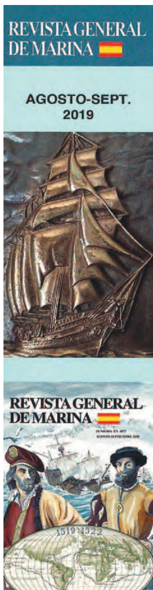
Elcano y Magallanes en un marcapáginas de la REVISTA GENERAL DE MARINA de agosto-septiembre de 2019.

cartel de la película, entre otras cosas, muestra las caricaturas de Magallanes y Elcano.