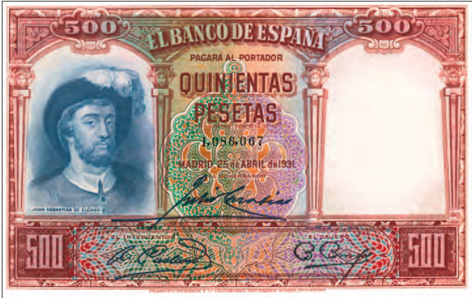
Anverso de un billete de 500 pesetas emitido en 1931 con la efígie de Elcano. (Colección Marcelino González)

Nuestra Señora la Antigua, en acción de gracias por su regreso a España. Se trata de la reproducción de un cuadro al óleo, de 254 por 239 centímetros, pintado en el año 1919 por Elías Salaverría Inchaurrendieta, en el IV Centenario del comienzo del viaje de Magallanes-Elcano, que se conserva en el Museo Naval de Madrid. Y en la esquina de la derecha del billete, aparece una imagen de la nao Victoria .