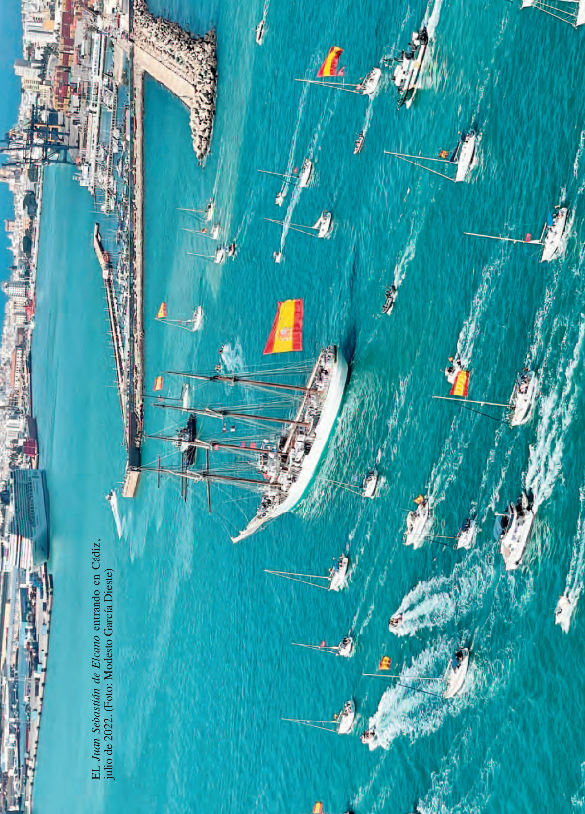
El Juan Sebastián de Elcano entrando en Cádiz, julio de 2022.