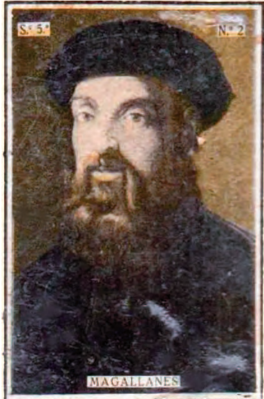
Retrato de Magallanes en una caja de cerillas.

A modo de ejemplos podemos citar una caja de una serie dedicada a personajes históricos, en la que aparece un retrato de Magallanes. Otra caja, dedicada al buque escuela de la Armada Juan Sebastián de Elcano , muestra su escudo, que es el mismo escudo que Carlos I dio a Elcano cuando en 1522 regresó a España, ya comentado anteriormente.