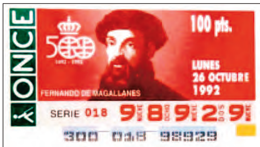
Cupón de la ONCE, del lunes 26 de octubre de 1992, con la efigie de Magallanes.

de sobrevivir en una sociedad atrasada, empobrecida y deprimida socialmente. Estas asociaciones aparecieron sobre todo en Andalucía, Levante y Cataluña. Muchas de ellas terminaron uniéndose para mejorar sus beneficios y conseguir la protección del Estado, dando lugar a la Organización Nacional de Ciegos (ONC).