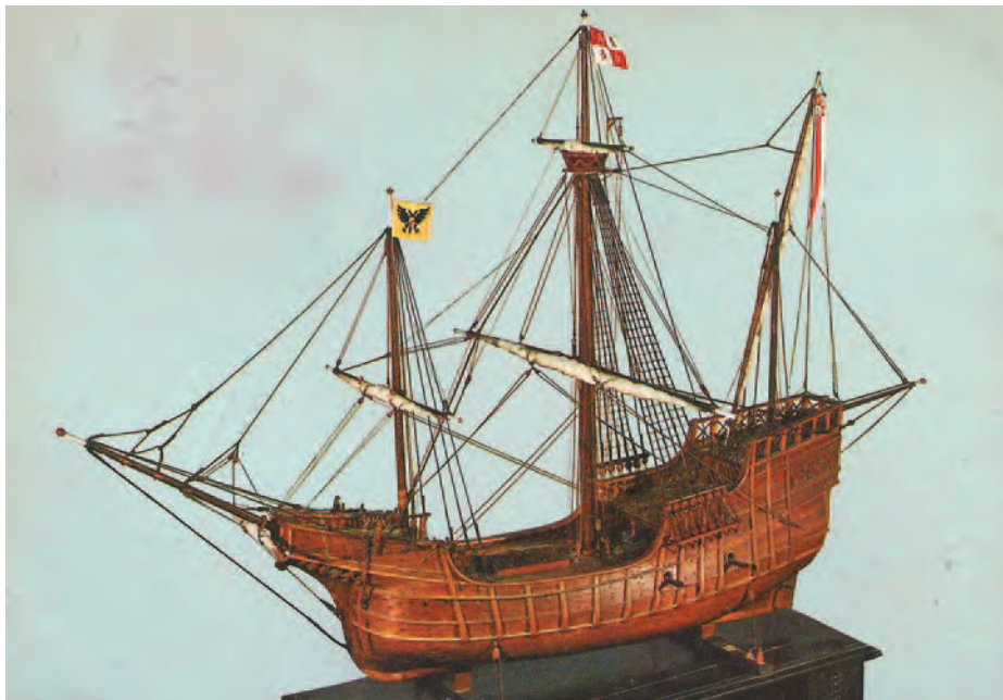
Modelo de la nao Victoria conservado en el Aquarium de San Sebastián en una tarjeta postal.

Al principio, las postales eran estatales. Fueron mejorando con el tiempo, aumentó su uso hacia la última década del siglo XIX con la mejora de las técnicas de impresión, y alcanzaron gran popularidad, sobre todo, las emitidas por empresas privadas. La Unión Postal Universal reguló entonces sus dimensiones en unos 9 x 14 cm, tamaño que se mantuvo hasta alrededor del año 1960 en que se aumentó a unos 10,5 x 15 centímetros.