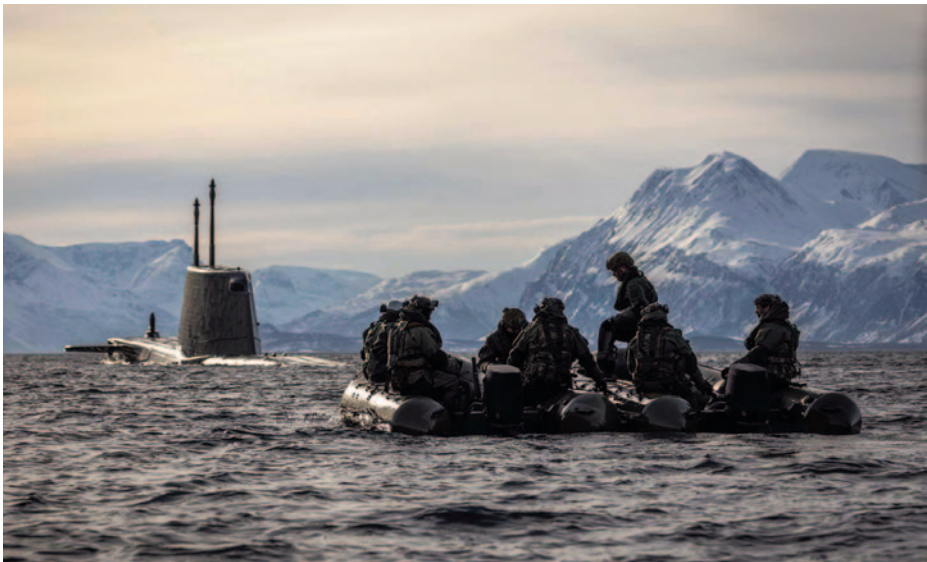
Royal Marines proyectados desde un submarino durante el Ejercicio COLD RESPONSE-22.

La dedicación casi en exclusiva del 3 CDO BDE a campañas eminentemente terrestres ha supuesto igualmente una degradación en la experiencia y conocimientos anfibios. Se ha perdido una parte importante de ese conocimiento