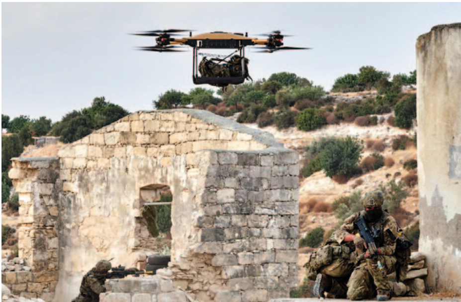
Royal Marines recibiendo apoyo logístico desde el dron de carga Malloy Aeronautics . The Defense Post . (PO (Phot) Si Ethell. Crown Copyright)

La opción de enfrentamiento total se contempla y permanece como la idea central, pero debe ser equilibrada con una mayor utilidad a través del espectro de operaciones en la zona gris. Esto exige ser lo suficientemente ágil para explotar oportunidades y minimizar riesgos. Es decir, desarrollar actividades en la zona gris no puede implicar perder la capacidad de proporcionar una respuesta como un batallón/brigada ligera cuando surja la necesidad. En ese contexto, puede operar como una fuerza avanzada parte de una fuerza conjunta mayor, proporcionando efectos limitados: como por ejemplo, controlando un APOD/SPOD (4) durante un tiempo determinado.