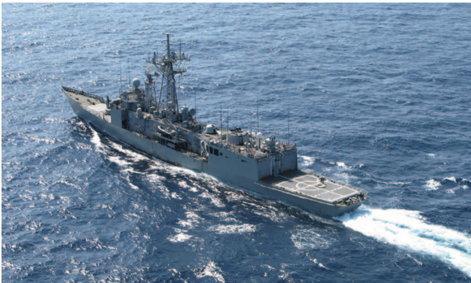
Fragata Victoria .

Cuando hablamos de estos requisitos (CLD o permanente), simplemente basta con estar destinado en una de las unidades donde se cumple «tiempo de embarque». Sin embargo, este computa aun cuando un militar está sujeto a medidas de conciliación y, por lo tanto, exonerado de navegaciones en la mayoría de los casos.