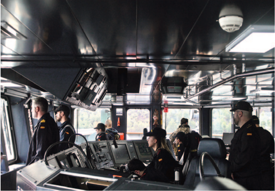
Puente de mando del BAC Cantabria.

por defecto de refuerzo de personal fuesen los destinos en tierra y no el resto de buques de la Flota, que también sufren el problema. Podría pensarse en un sistema de designación previa para cubrir vacantes en caso necesario, asociado a los puestos de trabajo en tierra, que agilizaría la cobertura de destinos y eliminaría el efecto «subasta» que actualmente tiene la exploración para cubrir necesidades antes de cualquier navegación (frases como «se percibirán retribuciones por aguas extranjeras» o «tendrán prioridad para participar en el despliegue»). Algo parecido al concepto de crisis establishment que existe en el ámbito de las plantillas de personal en los estados mayores embarcables.