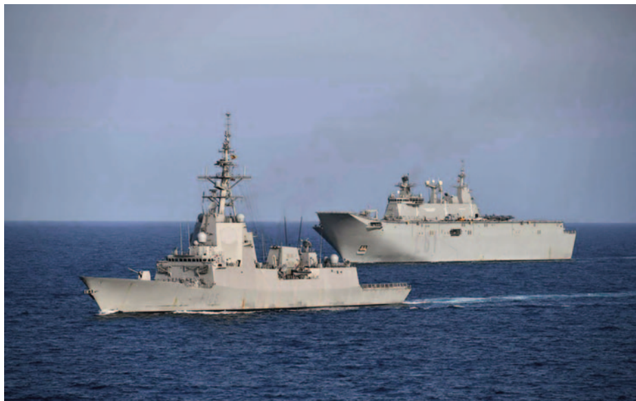
Ejercicio FLOTEX.

Por lo tanto, parecería adecuado que si existe una solución adoptada en la Instrucción 42/20 para las ausencias de larga duración (más de un año) derivadas de estado de gestación, permisos por parto, adopción o acogimiento y lactancia, pudiera haber una herramienta semejante para ausencias de larga duración derivadas de la medida accesoria de exoneración de la de reducción de jornada por guarda legal de hijo menor de 12 años.