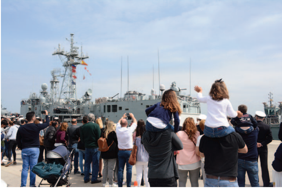
Salida de la fragata Numancia en una de sus incorporaciones a la Operación Sophia.

la entrada en vigor de la Orden DEF/253/2015, por la que se regulaba el régimen de vacaciones, permisos, reducciones de jornadas y licencias de los miembros de las Fuerzas Armadas y que posteriormente fue modificada por la DEF/112/2019. Con la publicación de estas medidas nace la Instrucción 42/20, que deroga todas aquellas normas de la Armada que habían quedado obsoletas.