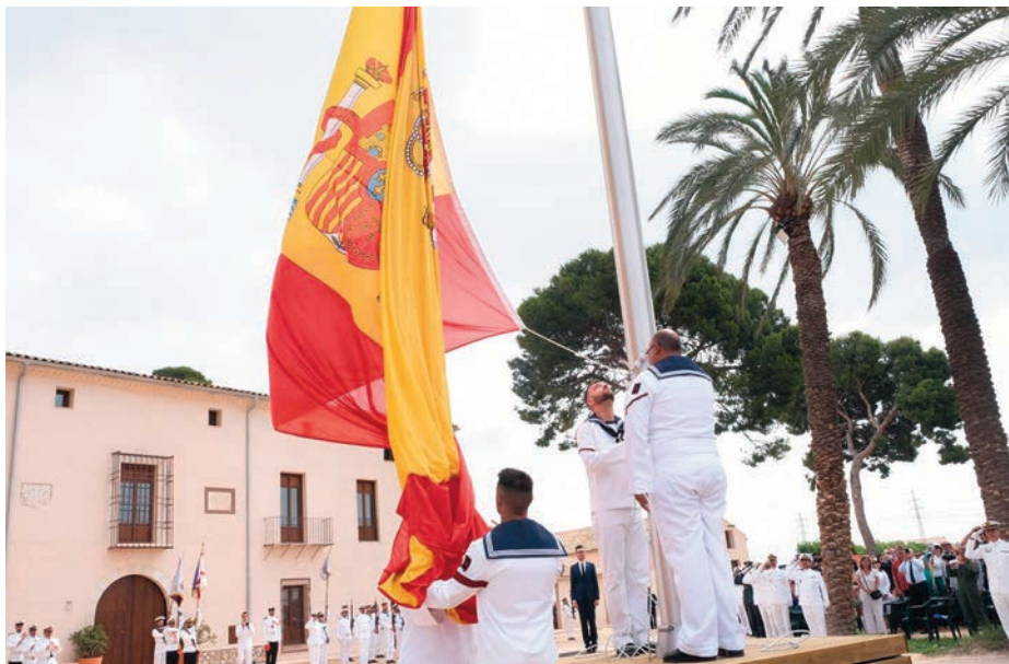
Izado de la Bandera por el 250 aniversario de la muerte de Jorge Juan.