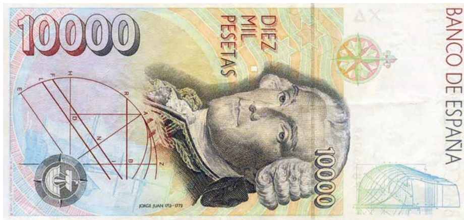
Billete de 10.000 pesetas con la efigie de Jorge Juan.

colectiva de nuestro país como pocos pueden hacerlo», y que personificó cualidades tan propias de la Armada española como «el conocimiento, la inteligencia y la vocación de servicio que encarnó este ilustre marino».