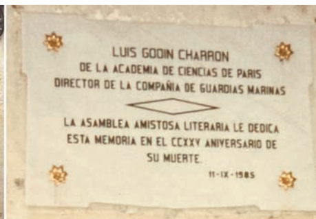
Placas colocadas por la Asamblea Amistosa Literaria.