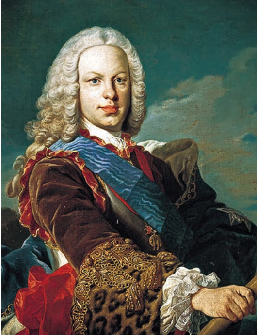
Retrato del rey Fernando VI, de Louis-Michel van Loo. Museo del Prado. (Fuente: www.wikiopedia.org )

seno propiciaron nuevas instituciones y centros de estudio de la ciencia aplicada. Así, en Barcelona se crearon el Cuerpo de Ingenieros Militares y las Academias de Matemáticas y de Artillería. Y en Cádiz, la de Guardiamarinas, el Colegio de Cirugía de la Armada, el Observatorio Astronómico, etc. En palabras del historiador Antonio Lafuente: «Puede calificarse este proceso como militarización de la ciencia española de la Ilustración».