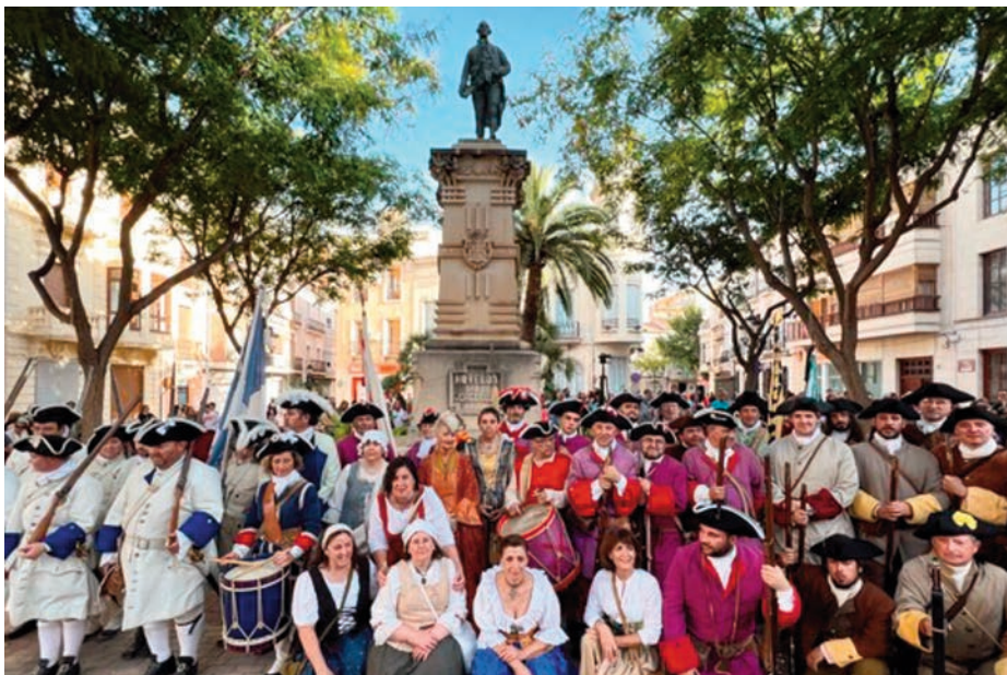
Homenaje a Jorge Juan con milicias del siglo XVIII.