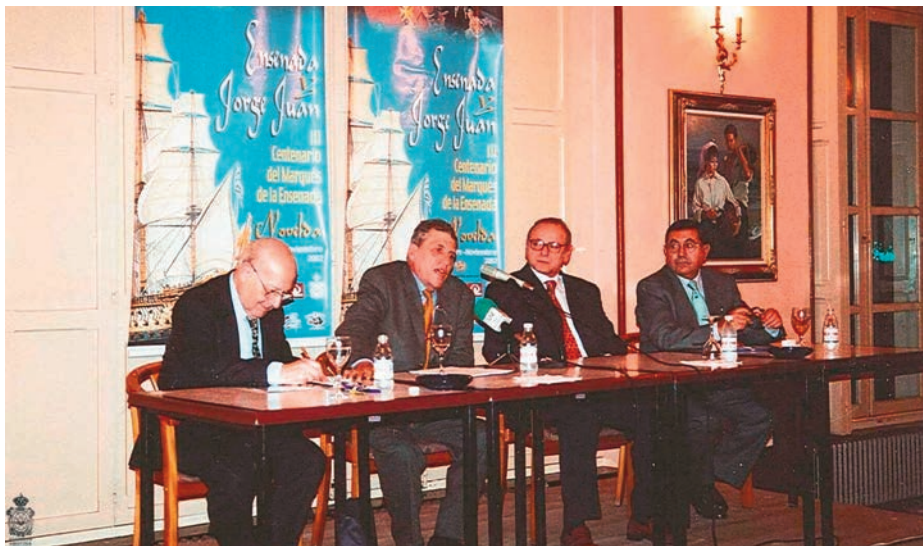
IX Jornadas de la Ilustración. Conferencia celebrada en el Casino de Novelda.

y la última al 450.º aniversario de la batalla de Lepanto—, del 7 de octubre al 20 de noviembre de 2021, además de conferencias, exposiciones, presentaciones de libros, etc. En la mayoría de tales Jornadas se suelen organizar un recorrido por lugares relacionados con el ilustre marino, como la casa de El Fondonet donde nació y la Casa-Museo Modernista de Novelda, que conserva una importante colección de documentos originales sobre Jorge Juan. Este edificio pertenece a la Fundación Mediterráneo (CAM), que en 1996 adquirió el legado, constituido por cartas personales, relación de bienes al morir, objetos de medición, árbol genealógico, una colección original de manuscritos, etcétera. Siguiendo con el itinerario, se visita la iglesia de San Pedro, donde se celebra todos los años una misa de réquiem para conmemorar el aniversario de su muerte. A continuación, se visitan los salones del Ayuntamiento y el monumento a Jorge Juan, donde se deposita una corona de laurel y posan los asistentes para una fotografía de familia. También es sitio obligado el Casino de Novelda —referente social y cultural de la capital del Vinalopó desde hace 125 años—, con una zona ajardinada en pleno centro urbano y un espléndido edificio en cuyos salones se han celebrado muchas conferencias y exposiciones de la Asamblea Amistosa Literaria.