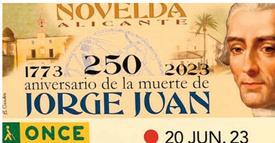
Aniversario de la muerte de Jorge Juan en un cupón de la ONCE.

Asimismo, anunció que en el interior de la casa podía visitarse una exposición sobre los originales de todas las obras escritas por Jorge Juan, su legado y sus facetas como matemático, espía, diplomático, científico o marino, gracias a la colaboración de la Fundación Mediterráneo, el Ayuntamiento de Novelda y el Museo Comercial de Alicante.