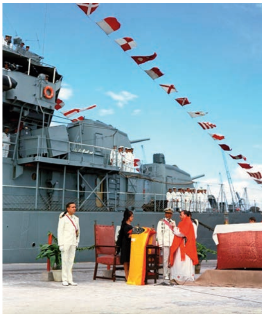
Entrega de la bandera de combate al destructor Jorge Juan en Alicante.

Aunque aún su figura continúa siendo una gran desconocida por la mayoría de los españoles, a pesar del gran esfuerzo que se hizo con motivo del tercer centenario de su nacimiento. Para tal efeméride, se presentó en el Congreso de los Diputados una proposición no de ley que fue aprobada por unanimidad de la Cámara. La defensa de tal propuesta corrió a cargo del portavoz de Cultura del Partido Popular, quien destacó que tal personalidad histórica «va más allá de su localidad natal para proyectarse en la memoria