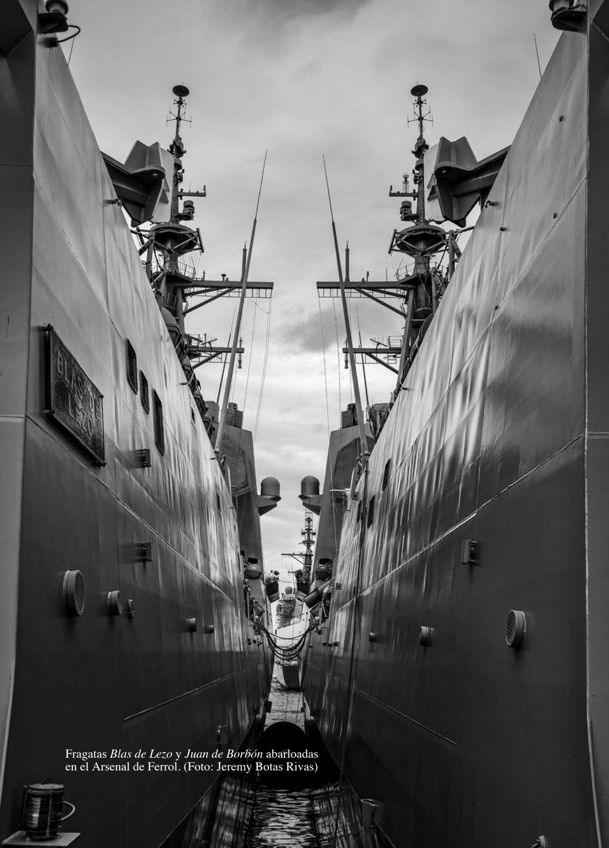
Fragatas Blas de Lezo y Juan de Borbón abarloadas en el Arsenal de Ferrol.