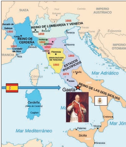
La península itálica en 1849. (Elaboración propia)

El 23 de marzo de 1848 comenzaron las guerras por la unificación de la península italiana, con un ejército revolucionario liderado por Giuseppe Mazzini y Giuseppe Garibaldi. Tras tomar los Estados Pontificios y mantener al papa Pío IX secuestrado durante unos meses en el Vaticano, éste consiguió fugarse de su cautiverio el día 24 de noviembre de 1848 gracias a la colaboración de los embajadores de España y Francia. Frustrada la idea inicial de ser evacuado a Mallorca a bordo del buque español Lepanto , el papa se refugió en la ciudad de Gaeta, en el Reino de las Dos Sicilias. Desde allí pidió la ayuda de todas las naciones católicas europeas.