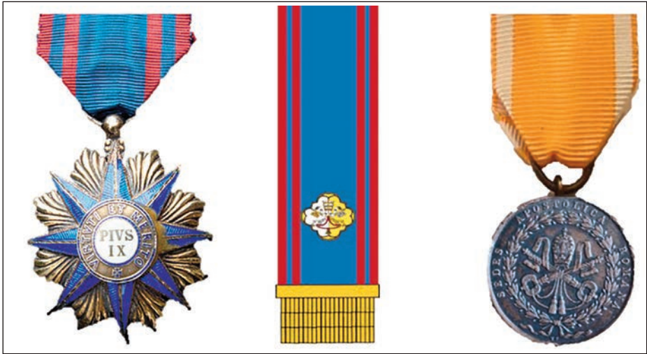
Medalla y Corbata de la Orden Piana y Medalla de Gaeta. (Elaboración propia)

participantes en la expedición, la medalla de la Orden Piana. Posteriormente, el general Fernández de Córdoba solicitó al Papa que concediese a las banderas de los batallones participantes una corbata con los colores de la Orden». En el libro Expedición a los Estados de la Iglesia (1849-1850) , de Gonzalo de Porrás (Defensa, 2008), se señala que «por Real Orden de 10 de abril de 1850, se autorizó que las banderas y estandartes de todos los batallones y unidades que hubiesen tomado parte en la expedición ostentasen a perpetuidad la Corbata de la Orden Piana».