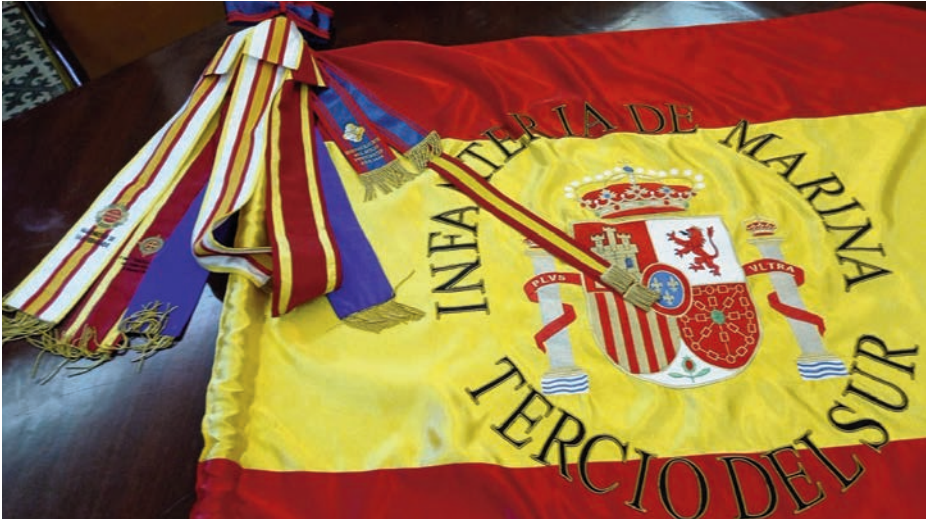
Bandera del Tercio del Sur

oficiales que mandaron guarniciones pertenecían al arma de Artillería de Marina, si bien algunas de ellas, las de menor entidad, tenían por jefe a un sargento. Muchos de estos infantes de marina, formando parte de los trozos de desembarco de esos buques, fueron los que tomaron Terracina y todas sus fortificaciones.