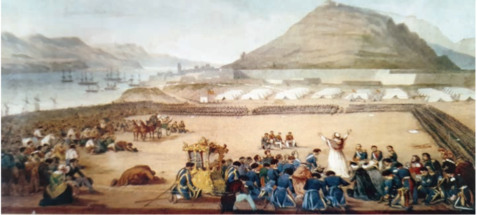
El papa Pío IX bendice a las tropas españolas que acuden en su ayuda en las costas de Gaeta, litografía de Víctor Adam.

las baterías montadas... otra al 2.º batallón del regimiento de Ingenieros; y la última al batallón de Infantería de Marina». Continúa diciendo que «el Papa Pío IX creó la medalla de la restauración del Solio Pontificio... y la concedió generosamente a todos los soldados y marinos españoles que habían participado en aquella campaña».