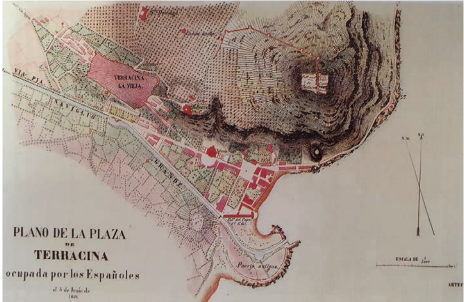
Plano de la plaza de Terracina en 1849, por Gómez de Arteche. (Fuente: Diario de Operaciones del Cuerpo Expedicionario a los Estados Pontificios (1849-50) , de Vicente Puchol)

divisar los buques españoles. Al día siguiente, los españoles le entregaron la ciudad al rey de las Dos Sicilias, Fernando II. En esta acción destacó el ayudante de órdenes de la División, el teniente de navío Juan Bautista Topete, al mando de los trozos de desembarco que conquistaron la torre Gregoriana y todas las posiciones enemigas en esa población. En esos trozos se integraban 150 infantes de marina de las guarniciones de los navíos, según se data en los estados de fuerza de los batallones de Infantería de Marina de aquellos meses y en el Reglamento General de las Guarniciones y Tripulaciones de buques en vigor en esa fecha.