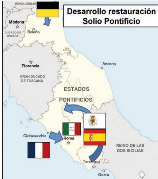
Movimientos de las fuerzas austriacas, francesas, españolas y del Reino de las Dos Sicilias. (Elaboración propia)

El 3 de julio, los franceses conquistaron Roma, finalizando así la efímera República romana, con la huida de Garibaldi y Mazzini y la vuelta del papa Pío IX, si bien el regreso del contingente español no comenzaría hasta el 24 de enero de 1850. Esta intervención de España propició el acercamiento entre la Santa Sede y el gobierno de Isabel II, lo que favoreció la firma del Concordato de marzo de 1851 y el apoyo del Vaticano frente al carlismo.