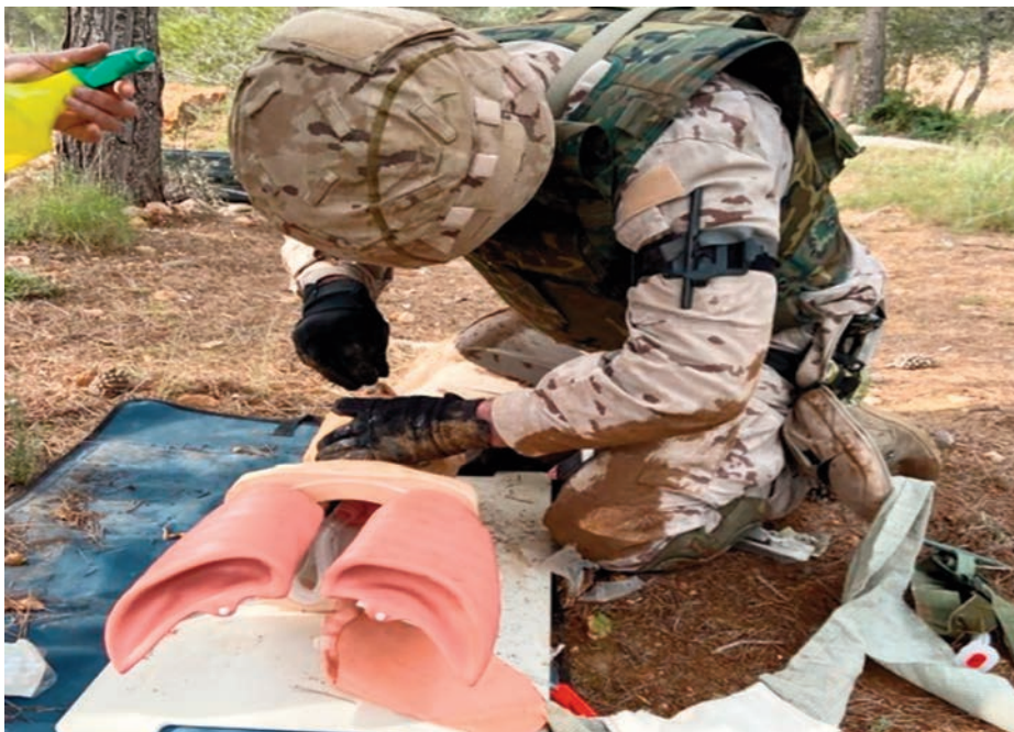
Alumno del curso ASCAR practicando con un maniqué de simulación.

necesarias que le permitan resolver, como primer interviniente, aquellas heridas que en combate ocasionan un alto porcentaje de muertes entre los heridos.