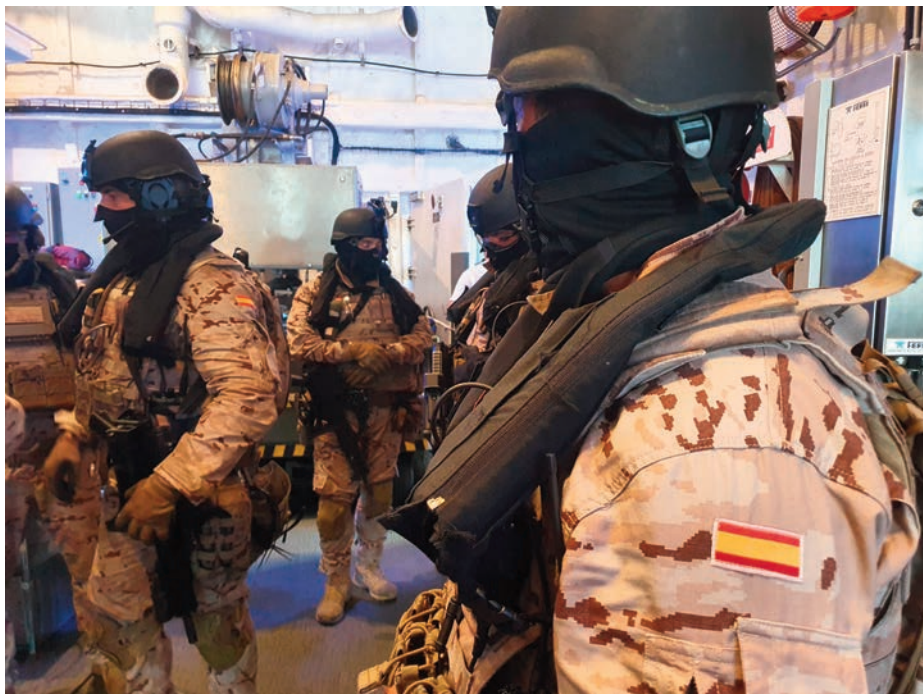
Infantes de marina del PC2N alistados para comenzar una MIO.