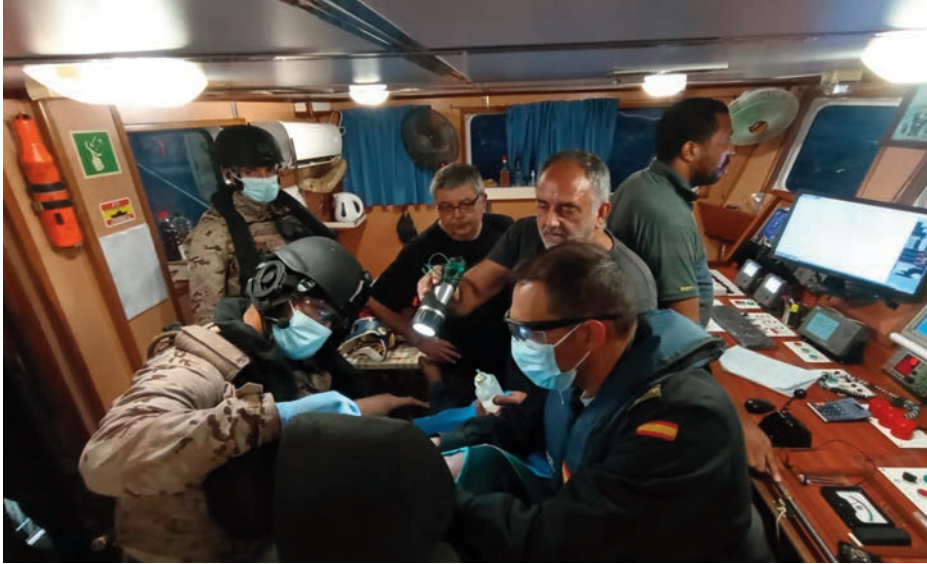
Sanitario del PC2N de la Unidad de Seguridad de Canarias (USCAN) prestando ayuda sanitaria a un pesquero español durante una MSA Approach .