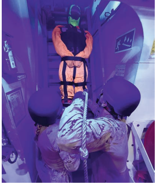
Ejercicio de transporte de herido.

Ante cualquier incidencia médica, los sanitarios proporcionan en primera instancia la asistencia necesaria hasta la llegada del personal facultativo y, por