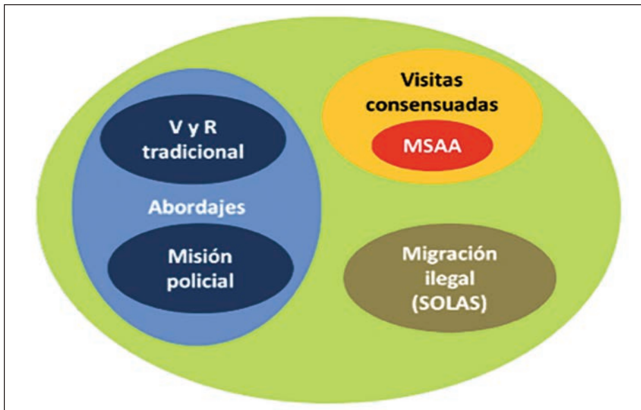
Tipos de abordajes, visitas y otras acciones del TVR.