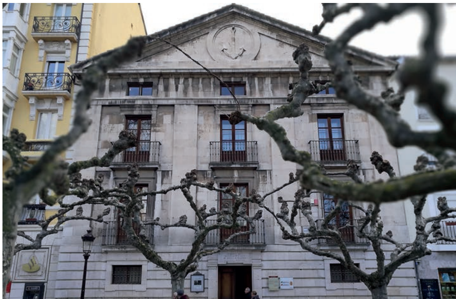
Consulado del Mar de Burgos.

factores y un largo etcétera de litigios que hasta entonces sufrían largas demoras.