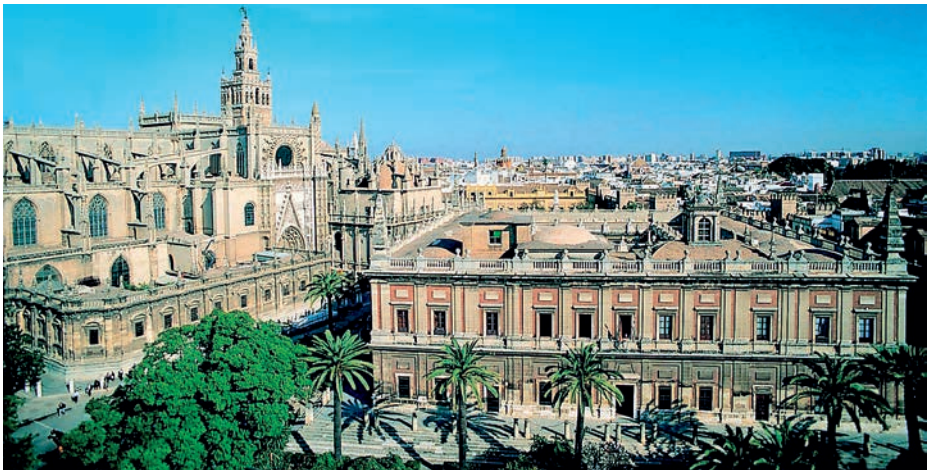
Casa de la Contratación en Sevilla.

El monopolio del tráfico indiano otorgado por el Estado a Sevilla exigió la creación en 1503 de la Casa de la Contratación siguiendo el modelo portugués: una especie de ministerio del comercio entre España y América; al margen de ésta, los mercaderes sevillanos trataron muy pronto de defender sus intereses mediante la constitución de un consulado, que fue aprobado en 1543 y denominado Consulado o Universidad de los Cargadores de las Indias, coexistiendo por tanto en la capital andaluza dos organismos, uno estatal y otro particular, encargados del comercio indiano. Dentro de esta trayectoria, el Consulado obtuvo en 1573 la revocación del privilegio otorgado por Carlos I en 1529 —que había permitido a los puertos de La Coruña, Bayona, Avilés,