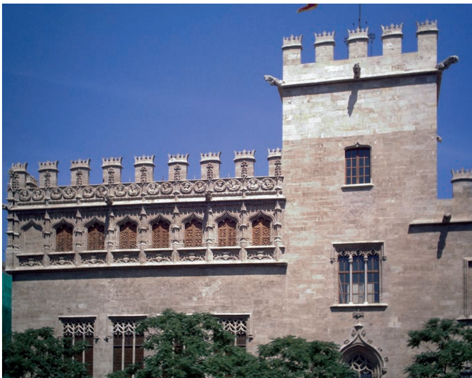
Consulado del Mar de Valencia.

La Lonja de los Mercaderes es el primer centro de contratación mercantil valenciano: una institución medieval donde desde hace cuatro siglos y medio siguen concurriendo a diario comerciantes, industriales y agentes comerciales dedicados al negocio de los productos allí cotizados. Su gobierno y dirección