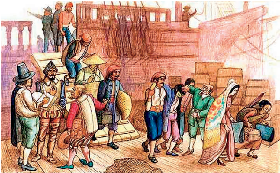
Comercio en los virreinos.

Desde el siglo XIII, los vascos mantuvieron estrechas relaciones comerciales con los puertos del norte europeo, siendo el Consulado de Brujas su referente. El hierro, en bruto o elaborado, fue su principal mercancía, seguido de las lanas castellanas, los vinos, el aceite y los cereales, e inversamente se