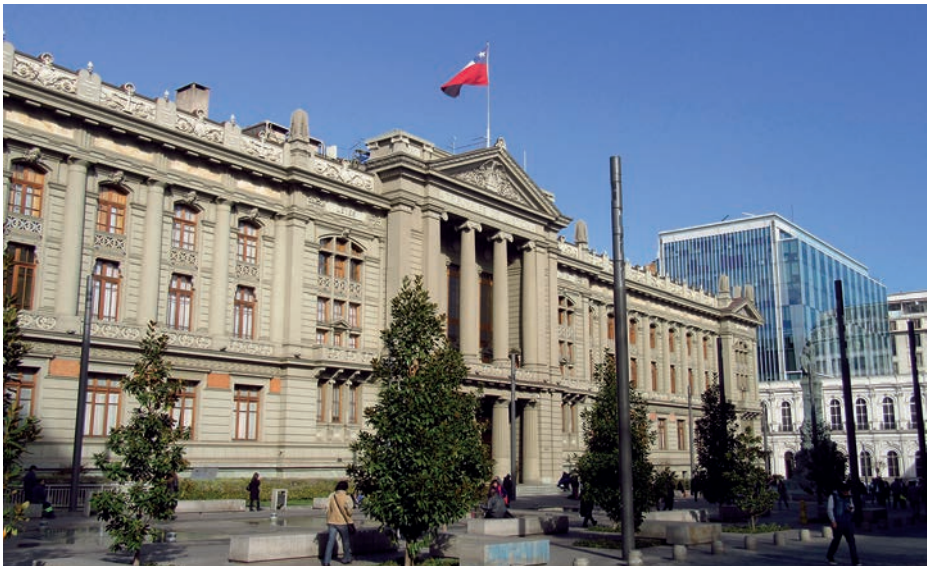
Tribunal del Consulado de Santiago de Chile.

Afianzado el control español en América, se fundaron los consulados de comercio en el continente. Previamente, como hemos visto, se había creado el sevillano para controlar el comercio entre España y aquellos territorios ultramarinos. En la otra orilla se establecieron el Consulado de Comerciantes de México, en 1592, y el Tribunal del Consulado de Lima, en 1613. El mexicano se creó a instancias de los comerciantes españoles residentes en la capital azteca, a donde debían transportar sus mercancías para exportarlas a Europa