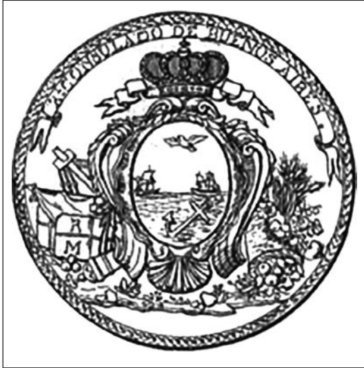
Sello del Consulado Real de Buenos Aires.

vía el puerto de Veracruz. El modelo para su creación eran los consulados de Burgos y Sevilla y su nombre legal completo fue «Universidad de los Mercaderes de la ciudad de México en Nueva España, y sus provincias del Nuevo Reino de Galicia, Nueva Vizcaya, Guatemala, Yucatán y Soco-nusco y los reinos de Cartage-na, Perú e Islas Filipinas», lo que recoge fielmente su primer ámbito de actuación. En el caso del comercio exterior, los únicos lugares en los que podían mercadear los agremiados eran los puertos de Sevilla y Manila, para este último mediante las flotas de Filipinas —más conocida como la