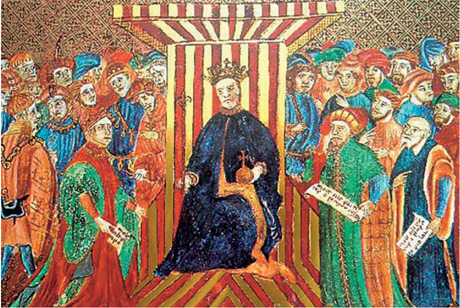
Códice del siglo xv.

radican en el Consulado de la Lonja, inspirado en la tradición del Consulado del Mar de Valencia, que existió durante los siglos XIII al XVIII. Fue fundado por Pedro III de Aragón en 1283 o, según otros, por Jaime I, de acuerdo a un famoso códice del siglo xv que comprende las «Costumbres del Mar» y la «Ordenación» o procedimiento judicial, que es de los más antiguos que existen en España e incluye, entre otros privilegios, el de «juzgar breve y sumariamente».